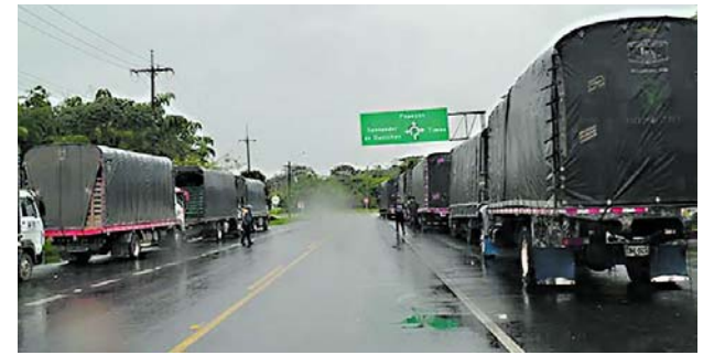
La vía Panamericana sería nuevamente bloqueada por la comunidad en el Cauca.

En ese orden, Dilian Francisca Toro, hizo su segunda solicitud al Ministro de Justicia y del Derecho, Néstor Iván Osuna Patiño, para que, se dé cumplimiento a la medida de cárcel de máxima seguridad y control de sus comunicaciones que asegure que el presunto líder de la Banda La Inmaculada, no delinca desde la prisión.