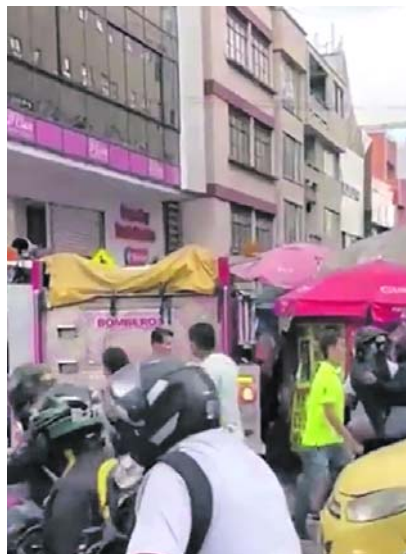
Captura de pantalla

Durante los últimos 30 años, el Comité Interinstitucional de Muertes por Causa Externa (CIMCE), compuesto por la Policía Metropolitana de Cali, la Fiscalía General de la Nación, La Personería de Santiago de Cali, el Instituto Nacional de Medicina Legal y Ciencias Forenses, el Instituto Cisalva de la Universidad del Valle y el Observatorio de Seguridad Distrital, apoyados por la Secretaría de Movilidad, se reúnen semanalmente los días martes para llevar a cabo la con-