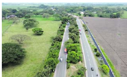
La doble calzada Cali- Candelaria está lista para ser entregada.

Como se recordará, la construcción de la doble calzada tuvo una inversión de 197 mil millones de pesos, fue financiada con