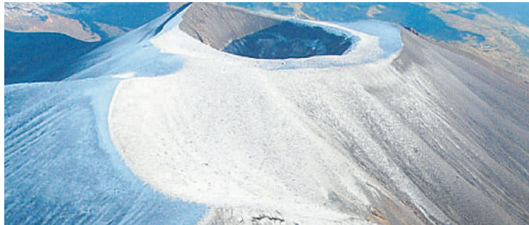
El monitoreo al volcán Puracé es permanente ante la actividad que presenta.

Así mismo, informó que “es muy probable que el volcán continúe emitiendo gases y ceniza, los cuales se dispersarán de acuerdo con el régimen de los vientos que impere en el momento de la emisión, lo que impli-