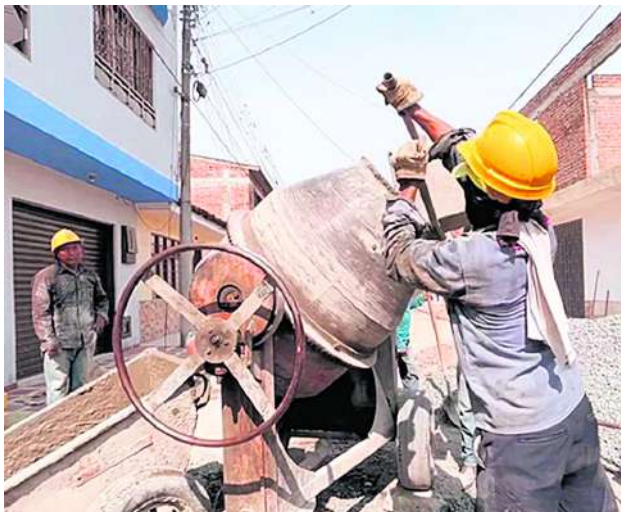
Modernizar las redes de acueducto y alcantarillado en los 33 municipios socios es una prioridad para Acuavalle.