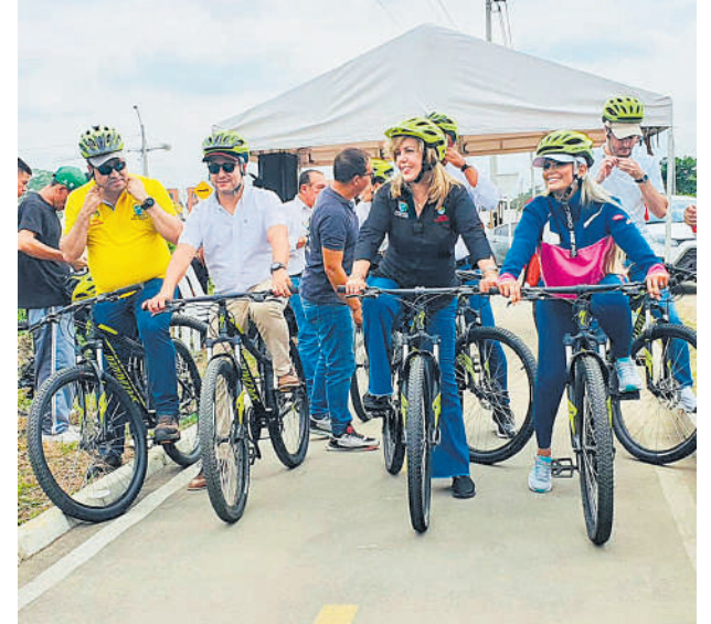
El Invías y el gobierno departamental recorrieron las obras de la doble calzada.

Adicionalmente, se realizó un recorrido por las obras del puente de Juanchito, donde se verificó el cierre de la calzada sur y el avance de las actividades que vienen siendo ejecutados en los accesos de Cali y Candelaria a la superestructura del puente.