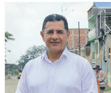
Alcalde de Santiago de Cali, Jorge Iván Ospina

Entre los elementos notables de este paseo turístico se encuentran espacios versátiles, jardines urbanos, áreas para mascotas, cancha de fútbol, pista de skate, equipos para el ejercicio al aire libre, huertas y complementos que animan el recorrido. También incorpora 19 módulos con estructuras metálicas, donde habrá dos puntos de información a visitantes, 13 locales comerciales para emprendedores del sector, tarimas para presentaciones artísticas, biblio-parques y un apergo-lado que brindará sombra y refugio.