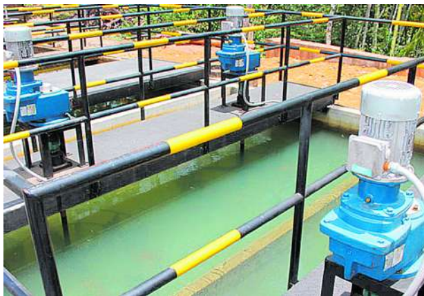
Los acueductos administrados por Acuavalle abastecen a los vallecaucanos con agua potable de calidad.

Además, agregó que “a su vez tenemos el control por norma que tiene que realizar la Uesvalle y donde nos arroja una calificación excelente frente al Irca”.