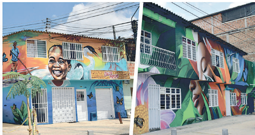
Los 53 murales alrededor del bulevar cuentan con una narrativa que resalta la biodiversidad y riqueza cultural de nuestro territorio

“Esta obra beneficiará a la comunidad, ya que proporciona apoyo cultural y deportivo. También le cambia la apariencia visual al sector. Ya no