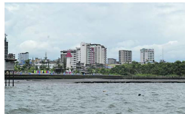
En tres operativos llevados a cabo en Buenaventura, la Fiscalía y Policía desmantelaron una banda dedicada al narcotráfico.

Así mismo, recordó que "desde la Fiscalía General en coordinación con un grupo élite desde Bogotá se destacaron fiscales especializados en lo que respecta al esclarecimiento de estos homicidios. Por parte de la Policía, un grupo élite de investigación y Ejército hace presencia en la zona y garantiza el control territorial".