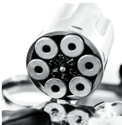
La comunidad denuncia la imposición de toques de queda por parte de bandas criminales, generando temor y desprotección.

Los residentes se sienten desprotegidos ante la constante comisión de delitos en la zona. Reportan ataques sicariales sistemáticos contra los jóvenes del barrio y el alto riesgo de ser reclutados por estas orga-