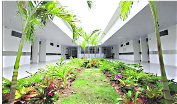
El Hospital Psiquiátrico Universitario San Isidro termina el cuatrienio completamente renovado.

ampliar la capacidad instalada y ofrecer una atención más humanizada a los pacientes.