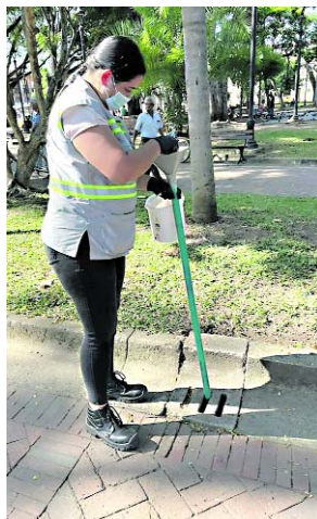
Ante la proliferación del dengue las autoridades de salud de Buga anunciaron medidas.

Debido a lo anterior la Secretaría de Salud viene adelantando diferentes