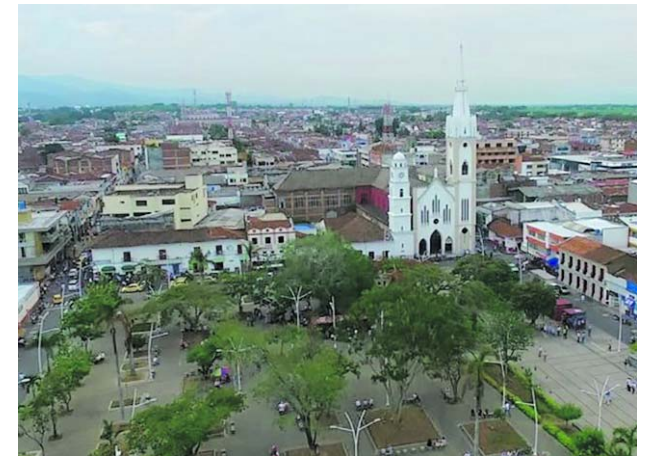
Fueron capturados los dos presuntos asesinos de un parapentista en el municipio de Tuluá.

Burgos manifestó que “estos proyectos nos ha permitido crecer en capacidad instalada, en el 2016 el hospital contaba con 220 camas, y con la sala que terminaremos este año tendremos 288 para el cuidado y bienestar de todos los pacientes vallecaucanos”.