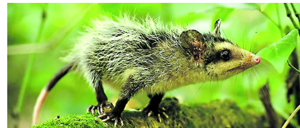
Una zarigüeya fue víctima de golpes por operarios de Promo Cali-Valle, desencadenando un repudio generalizado en la ciudad.

El coronel Vargas reiteró que los planes de las autoridades buscan prevenir hechos que afecten la integridad de los ciudadanos en la comuna. Aunque las amenazas no han sido directamente denunciadas hasta el momento, se están efectuando verificaciones para garantizar la seguridad de la población.