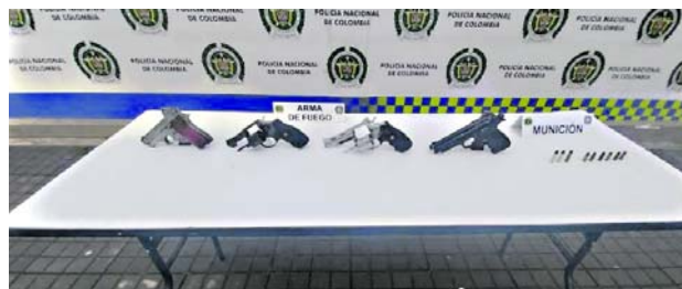
La Policía Metropolitana de Cali desarticula a 'Los del Hueco'. La banda estaba vinculada a homicidios, extorsiones y desplazamientos forzados.

un papel crucial en la banda, siendo el cerebro detrás de las extorsiones, la elección de víctimas y la orden de cometer homicidios y hurtos.