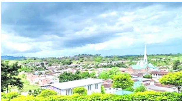
En un consejo de seguridad se analizó la masacre ocurrida en Trujillo.

mantes de procesos de paz y no tenían ordenes de captura vigentes, aunque dos de ellas tenían antecedentes por diferentes delitos.