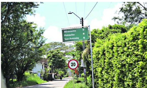
Jamundí ha tenido en los últimos meses dificultades de orden público.

jóvenes, los delincuentes “dijeron que los iban a liberar y ya los habían asesinado”.