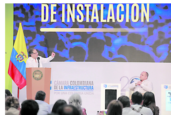
El presidente Gustavo Petro, durante su intervención en el Congreso Nacional de Infraestructura.

Este anuncio ha generado reacciones mixtas en la opinión pública y entre los sectores afectados. Mientras algunos analistas respaldan la decisión del gobierno como una respuesta necesaria ante las circunstancias, otros critican la falta de previsión y la dependencia de medidas que podrían afectar negativamente a la población y al funcionamiento de las institu-