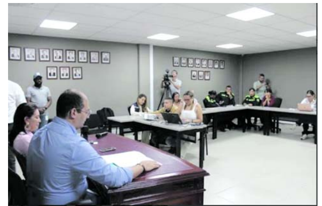
En un consejo de seguridad se analizó la violencia de género en el Valle.

Los familiares de las dos víctimas y un tercer joven que después apareció con su familia sano y salvo, habían sido reportados el fin de semana pasado como desaparecidos luego de haber participado de una fiesta en el corregimiento La Liberia.