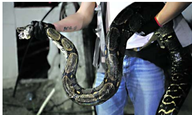
La boa fue entregada a las autoridades ambientales para su valoración.

Los profesionales del concesionario asistieron para realizar el rescate del ejemplar que medía más de dos metros.