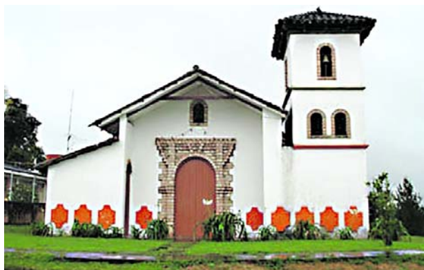
La incursión de las disidencias de las Farc se presentó en zona rural de Cajibío.