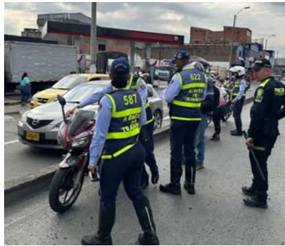
Operativo en Cali del 14 al 20 de noviembre: 1,264 comparendos y 300 vehículos inmovilizados.

La persistente invasión de los carriles exclusivos del MIO ha generado una creciente molestia entre la ciudadanía, que manifiesta su cansancio ante el irrespeto continuo por parte de algunos conductores. En particular, la intersección de la Carrera 15 con la Calle 15 se destaca como uno de los puntos más problemáticos,