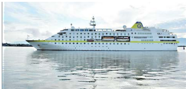
El crucero turístico internacional 'Hamburg' llegó a Buenaventura con 306 turistas alemanes.

un recorrido por los principales sitios de interés del territorio, disfrutar de su gastronomía y de muestras artísticas y culturales, organizadas por la administración local, que busca que esta zona del país se convierta en un destino turístico imperdible.