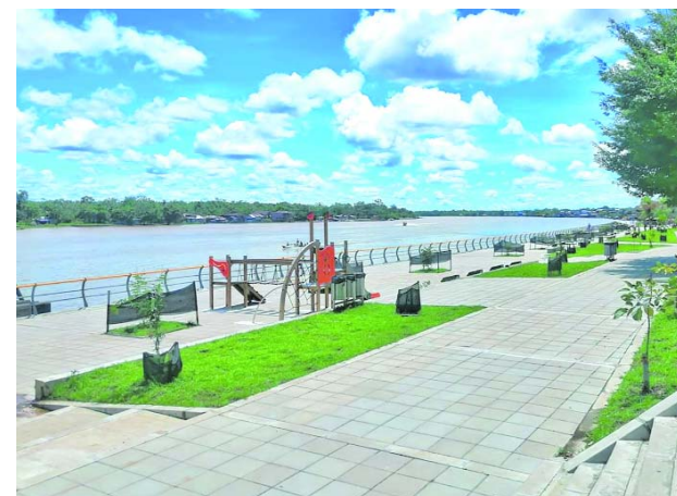
Hay preocupación en Chocó por la circulación de un panfleto amenazante.

Precisamente el Consejo Regional Indígena del Cauca, Cric, denunció que se han reportado 164 casos de reclutamiento de menores en lo corrido del año, siendo los municipios del norte los más afectados.