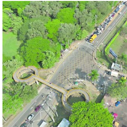
Son cuatro los puntos en la vía Panamericana que contarán con intersecciones semaforizadas.

La Alcaldía informó que en el próximo periodo constitucional, un nuevo calendario electoral deberá ser presentado para las elecciones de Jueces de Paz y Jueces de Paz de