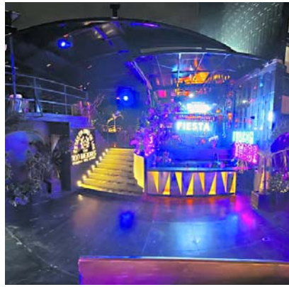
Jorge Iván Ospina, alcalde de Cali, anuncia la extensión del horario de rumba, impulsando el optimismo en la comunidad nocturna.

"Del vehículo intruso descendieron inicialmente siete individuos armados con fusiles y pistolas, quienes agredieron al personal de portería, la ronda y un residente", informó la administración del Conjunto. Agregando que las víctimas fueron posteriormente amarradas y encerradas en el baño, mientras los agresores perpetraban su acción. Acto seguido, el grupo se dirigió al semisótano de la