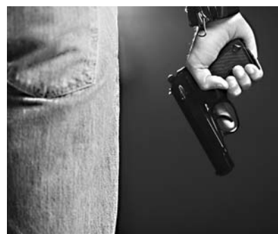
Siete individuos armados con fusiles y pistolas agredieron al personal de portería, la ronda y un residente en el Conjunto Índigo.

En sus declaraciones, Erazo resaltó la necesidad de que el alcalde Ospina comparta con el Concejo de Cali y la ciudadanía, a través de esta curul, cuáles son los planes de contención y seguridad.