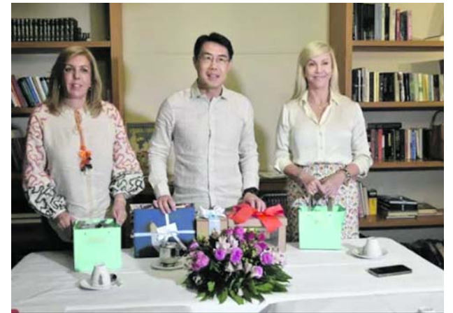
El embajador de China se reunió con las mandatarias entrante y saliente del Valle del Cauca.

El desarrollo de las mesas técnicas se realizó en tres fases, la primera la viabilización y elaboración de los estudios de factibilidad, la segunda la estructuración del proyecto de intervención y la tercera fase se hizo la expedición de las resoluciones.