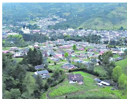
Hay alerta en el municipio de Silvia por los enfrentamientos entre grupos ilegales.

Otras versiones de los líderes establecen que las confrontaciones iniciaron luego que una facción de la