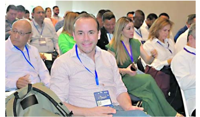
Alejandro Eder, alcalde electo de Cali, prioriza seguridad y cooperación en reuniones estratégicas antes de asumir el cargo.

La prioridad en este momento es esclarecer los hechos.