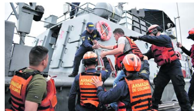
Las capacidades de los organismos de emergencia se pusieron a prueba en el simulacro.

Conda dijo que es necesario que las instituciones garantes de los Derechos Humanos intervengan, ya que los grupos armados han usado viviendas de civiles como escudos, lo que pone en alto riesgo a los habitantes.