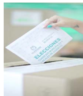
Ante la poca inscripción de postulantes a Jueces de Paz en Palmira se aplazó la elección.

Por su parte, la gobernadora electa del Valle del Cauca, Dilian Francisca Toro, dijo que “se dieron a conocer las condiciones en las cuales puede intervenir para trabajar con proyectos como el Tren de Cercanías, pero no solo eso, sino también cómo podemos lograr la transformación en el Valle del Cauca y generar empleos”.