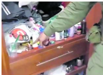
Varios allanamientos se llevaron a cabo en Jamundí y Popayán.

Según las autoridades, esta red de narcotraficantes operaba en familia, contaba con laboratorios clandestinos para la elaboración de clorhidrato de cocaína de su propiedad y se encargaba