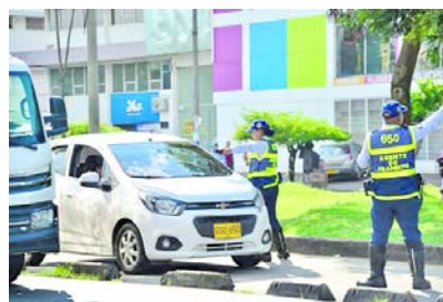
Vías cerradas para el brillo de la Feria de Cali. ¡Planifica tu ruta y celebra con responsabilidad!