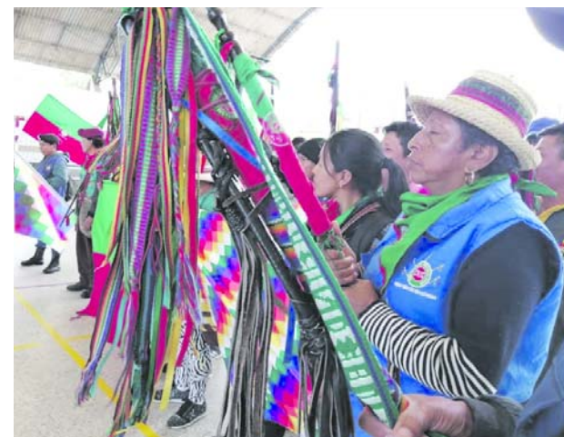
La guardia indígena reclamó a los grupos armados ilegales no vincular a la población civil.

El oficial indicó que la Armada de Colombia continuará desplegando todas sus capacidades logísticas y operacionales en el Pacífico colombiano.