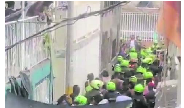
Vecinos capturan en video el enfrentamiento entre la comunidad y la Policía Metropolitana.

La Secretaría de Movilidad de Cali hace un llamado a la ciudadanía para comprometerse por la seguridad vial durante estas festividades de fin de año y así seguir apostándole a una movilidad para la vida.