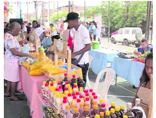
La Plazoleta de San Francisco será sede este miércoles del mercado campesino.

En la carta aseguran que eso quiere decir que Emiratos no usaría materia prima nacional para exportar azúcar hacia Colombia, sino materia prima importada de otro país, mientras que acá en Colombia “nosotros sí tenemos que esforzarnos cada día en cultivar la caña, correr con los riesgos climáticos que eso conlleva, cortarla, y luego con esa caña nacional producir azúcar para abastecer el país”.