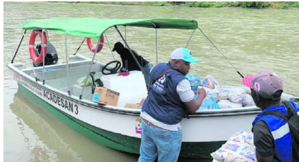
Las comunidades del Chocó se ven afectadas por el paro armado del ELN.

Los dirigentes sindicales firmantes recordaron que el sector azucarero genera más de 286 mil empleos de calidad en el suroccidente colombiano, los que se verían afectados con esta medida del gobierno nacional.