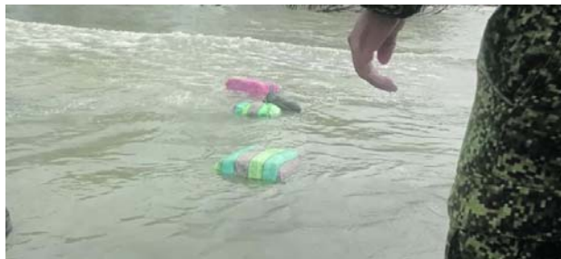
El material incautado por las autoridades fue encontrado flotando.

Según informó el Mayor de Infantería de Marina Luis Alberto Rincón Hurtado, oficial de Operaciones del Batallón Fluvial de Infantería de Marina No. 24., las tropas de la Brigada de Infantería de Marina No. 2 llegaron hasta Bocas de Aji sobre el río Naya, en área general del Distrito