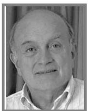
GUSTAVO ALVAREZ GARDEAZÁBAL

La verdad es absoluta. Colombia cada día está siendo más dominada por las bandas criminales, tanto en las ciudades grandes e intermedias, como en los municipios pequeños y en extensas regiones de los campos de la nación.