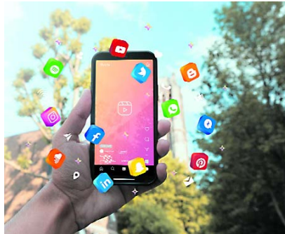
Empresas tecnológicas , incluidas en la nueva normativa, deberán cumplir con obligaciones fiscales en Colombia a partir de 2024.

La medida se extiende a proveedores de servicios digitales, como plataformas de streaming, publicidad digital y otros