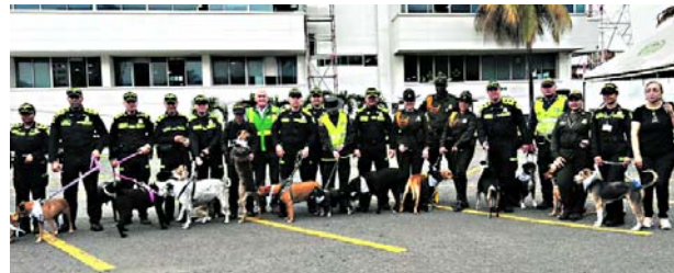
La lealtad de estos animales adoptados destaca en el homenaje de la Policía en Cali. Gracias a ellos, la seguridad se fortalece.

destaca la de Negro, el leal perro del CAI Panamericano que, a pesar de haber sufrido lesiones por un artefacto explosivo hace 12 años, sigue firme al lado de los uniformados. Su historia es solo una de muchas que resaltan el carácter fuerte y resiliente de estos animales adoptados.