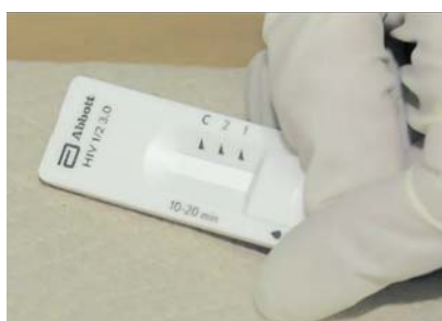
Este viernes, el HUV adelantará una jornada de pruebas rápidas del VIH.