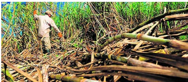
Hay preocupación de los trabajadores azucareros por un posible TLC con Emiratos Arabes Unidos.