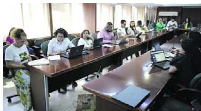
El empalme del gobierno entrante y saliente fue una transición ordenada y colaborativa entre administraciones