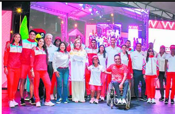
El apoyo al deporte fue una de las más importantes apuestas del gobierno departamental.