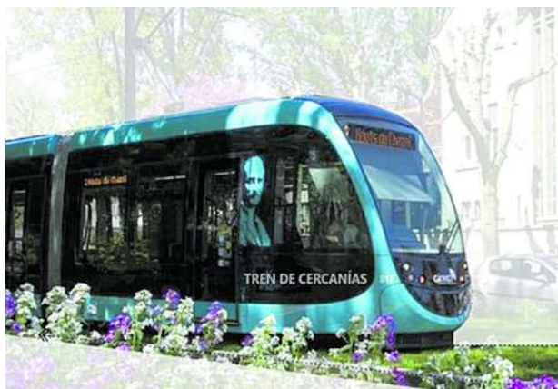
Proyectos como el del Tren de Cercanías los deja andando la mandataria regional con el apoyo del bloque regional de congresistas y los gremios.

De ellos, 150 gobernantes fueron seleccionados por sus indicadores de desempeño y gestión, y vivieron la última fase del proceso 24 finalistas en ocho categorías: seis de alcaldías y dos de departamentos. Los mandatarios sustentaron su trabajo en Gobernantes al Tablero y posteriormente expusieron sus experiencias en la Feria del Conocimiento. El Premio 'Mejores Gobernantes' 2020-2023 es una iniciativa de Colombia Líder, que cuenta con el apoyo de la Fundación Konrad Adenauer en Colombia (KAS), la Asociación Nacional de Industriales (ANDI) Visión 3030, la Fundación Bolívar Davivienda, Telefónica Movistar Colombia y su fundación.