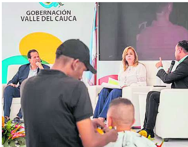
La gobernadora del Valle presentó la rendición de cuentas de los últimos cuatro años.

entes categorías que oscilaron entre los $2 millones y $50 millones en fondos como Valle INN Civismo para negocios afectados por el vandalismo, pero también Valle INN Mascotas y una convocatoria especial para los jóvenes entre 18 y 28 años.