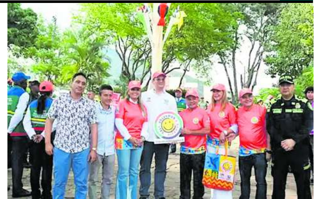
Con la campaña "Cali volvamos a sonreír" la Gobernación motivó el sentido de pertenencia de los caleños.