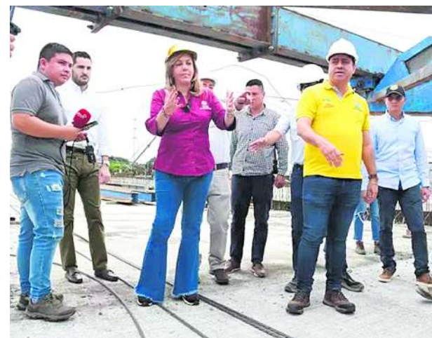
Un gran avance presentó la construcción del nuevo puente de Juanchito durante este cuatrienio.

El bicampeonato de los Juegos Nacionales de Mar y Playa 2021, con 39 medallas; la renovación del sistema de iluminación del Estadio 'Pascual Guerrero'; el Estadio de Atletismo 'Pedro Grajales' con su pista principal y auxiliar