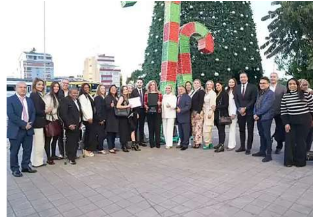
Con el orgullo del trabajo y la gestión por un Valle Invencible, los funcionarios de la Gobernación del Valle destacan la labor de la mandataria regional.

Parlamentario, nos permitió sacar adelante proyectos muy importantes a nivel nacional como las primeras 5G de la Nueva Malla Vial; la vía Buga-Buenaventura que la habíamos esperado por años; dejar el Tren de Cercanías con la factibilidad inscrita ante el Ministerio de Transporte, son proyectos que van a dejar mucho avance para el Valle del Cauca y que sabemos que van a continuar por esta senda”, dijo la mandataria al señalar que es “un honor nuevamente estar entre las tres mejores gobernantes del país. Gracias a todos los vallecaucanos que me dieron esa confianza y la oportunidad de gobernar durante cuatro años un departamento que amo tanto como es el Valle del Cauca, y como lo hemos manifestado todos los gobernantes, tanto alcaldes como gobernadores, fue de una época muy difícil con una pandemia, un estallido social y una ola invernal, sin embargo, con todas esas vicisitudes