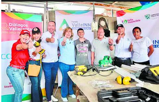
Con el programa Valle INN se impulsó la recuperación de la economía del departamento.