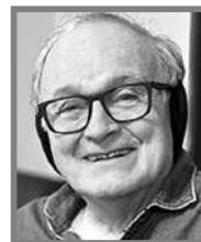
GUSTAVO ÁLVAREZ GARDEAZÁBAL

En Colombia hay fastidios de puño que se esculpen en la memoria popular y aunque son más invención que realidad nadie los destrona de la generalización despiadada. Lo hemos visto en los últimos años con los presos. Tristemente para la gran mayoría de colombianos un preso es un ser tan estigmatizado para siempre que cuando los matan a montones, como ocurrió el año pasado en la cárcel de Tuluá, donde mataron 62 seres humanos en una sola noche, nadie se mosquea. De la misma manera son muy pocos los colombianos que admiten que las remesas que se envían por parte de las diásporas colombianas regadas en muchos países del mundo son fruto del trabajo y el sudor de más de tres millones de compatriotas que cada mes giran a sus familias. Para los economistas, convertidos ahora en advinadores, esas divisas extranjeras no son significativas en el PIB porque apenas alcanza la