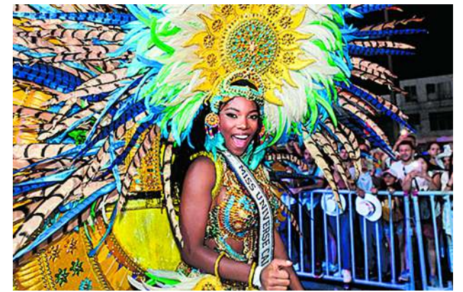
La 66 Feria de Cali será un punto de encuentro para los amantes de la música y la diversión, con más de 66 eventos programados en la ciudad.

La 66 Feria de Cali no se limita solo a la música y los desfiles. También ofrecerá actividades culturales y divertidas para toda la familia, incluyendo puestas en escena, carrozas, muestras gastronómicas y ferias de artesanías. Los asistentes tendrán