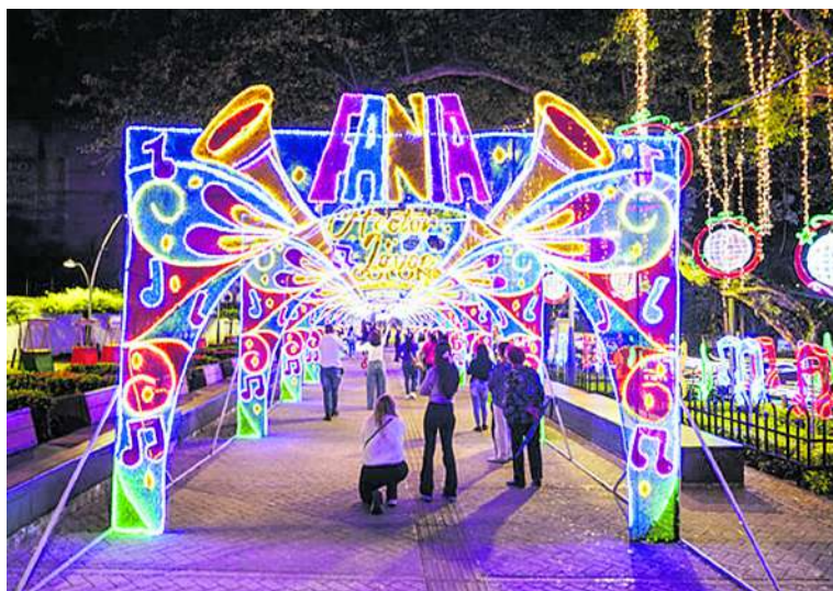
Este madrugón ofrece una alternativa para aquellos que desean evitar las aglomeraciones y disfrutar del alumbrado en un ambiente más tranquilo y exclusivo.