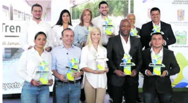
Con la presencia de los mandatarios salientes y entrantes se entregó el estudio de factibilidad aprobado del tren de cercanías.