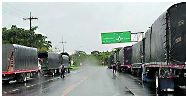
La vía Panamericana entre Cali y Popayán amaneció ayer nuevamente bloqueada por la comunidad.

“la petición que hacemos al gobierno es que se pueda hacer la mesa técnica que había sido programada para el 13 de diciembre se haga el día de mañana y así poder hacer el ejercicio de comunicación y de