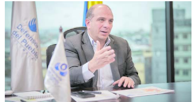
El Defensor del Pueblo, Carlos Camargo, expidió alerta temprana inminente en los municipios de Bolívar y Trujillo.

La Secretaría ha dispuesto de dos links para las mascotas perdidas.