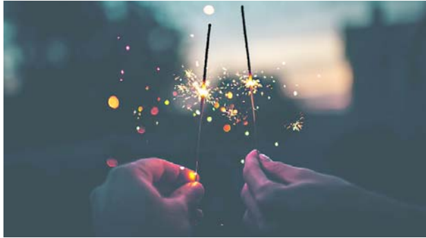
A través de un portal la Gobernación del Valle contabilizará los quemados por pólvora en el departamento durante estas festividades.

cada día se emite un boletín donde, lamentablemente, se contabilizan las personas quemadas en el departamento, el cual se puede consultar en tiempo real en la web del 'Tablero de pólvora' disponible en https://lookerstudio.google.com/u/0/reporting/631d04b8-91b9-423e-8acf-ecd9b8d3f6a9/page/p_s0mm71