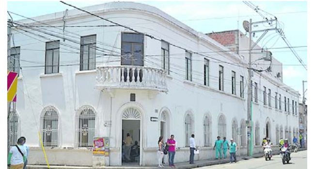
Hay preocupación en Jamundí por las acciones de los grupos ilegales.

Así mismo, los indígenas rechazaron los recientes asesinatos de sus líderes ocurridos en las últimas semanas y reclamaron una mayor seguridad.