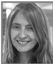
PALOMA VALENCIA LASERNA

E l Ministerio de Hacienda no emitió aval fiscal a la reforma a la salud. Emitió un “escenario de factibilidad”, y además con supuestos equivocados concluye que la reforma costaría 140 billones de pesos en 10 años.