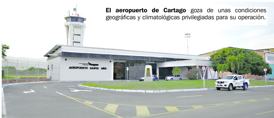
El aeropuerto de Cartago goza de unas condiciones geográficas y climatológicas privilegiadas para su operación.

garantizar la operación de aeronaves de mayor capacidad tipo Airbus A320, Boeing 737 y