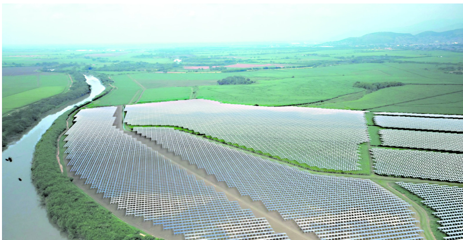
La apuesta del Ministerio de Minas es ayudar a Emcali a producir energías limpias.

Durante su más reciente visita a Cali, el