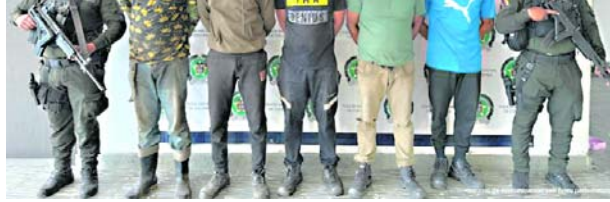
Los hombres intentaron hurtar 18 rieles utilizando una bala de oxígeno, un cilindro de gas de 40 libras, dos mangueras con su manómetro y un soplete.

detenidos estaban utilizando herramientas especializadas.