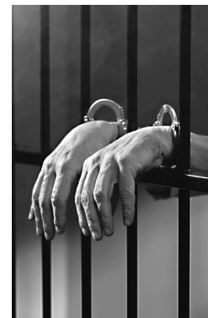
Supuestamente, aprovechó la confianza para cometer la conducta ilícita en el interior de una vivienda ubicada en el oriente de Cali, durante el año 2015.

Uno de los arrestos tuvo lugar en el barrio Cristóbal