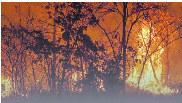
La Procuraduría enfatizó la importancia de las estrategias operativas para el almacenamiento de agua y la protección de fuentes hídricas

Riesgo de Desastres, UNGRD, para que ejecuten las recomendaciones previas y cumplan con las obligaciones legales relacionadas con la gestión de