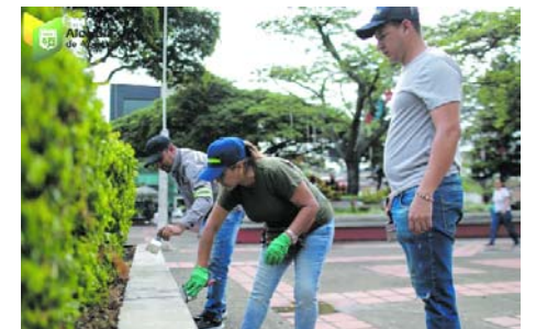
El Parque de Belalcázar es uno de los primeros espacios intervenidos.

Se busca además recuperar el sentido de pertenencia de los habitantes de la Capital