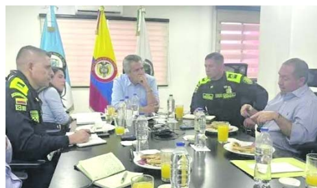
Junto con el Ministerio de Interior, se busca impulsar la instalación en Tuluá de cámaras inteligentes.

El mandatario de la ciudad Corazón del Valle afirmó que “estamos buscando que este Centro