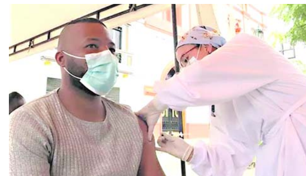
En el Valle del Cauca todavía hay disponibilidad de vacunas contra el covid -19.

La dirigente gremial precisó que “las alianzas público-privadas son ganadoras y la prueba está en las acciones que hemos venido haciendo con las gobernaciones en esa materia. Estamos convencidos que en este próximo paso que involucra a la gobernadora Dilian Francisca Toro vamos a continuar haciendo esas alianzas”.