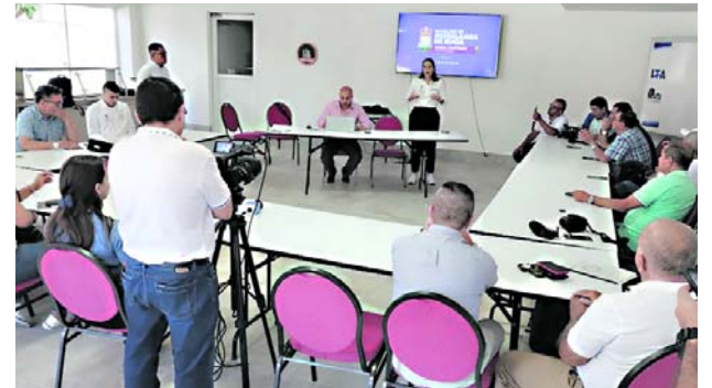
La administración de Buga tomó medidas para combatir consumo de alucinógenos y alcohol en espacio público.

Esta medida busca principalmente proteger a los niños, adolescentes y jóvenes que fre-