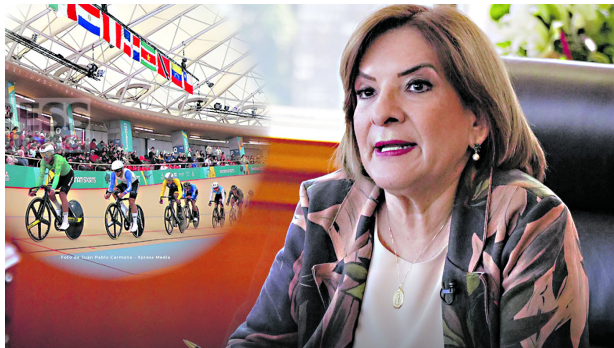
Astrid Bibiana Rodríguez está bajo investigación de la Procuraduría por presunta responsabilidad en la pérdida de la sede de los Juegos Panamericanos 2027.

La Sala Disciplinaria de Instrucción identificó que la exministra podría haber pasado por alto el cumplimiento de los artículos 1, 2 y 6 del Decreto 1670 de 2019. La investigación busca determinar si sus acciones contribuyeron al posible detrimento del patrimonio público, considerando la rescisión del contrato con la Panam Sports Organization y la pérdida de los recursos ya desembolsados.