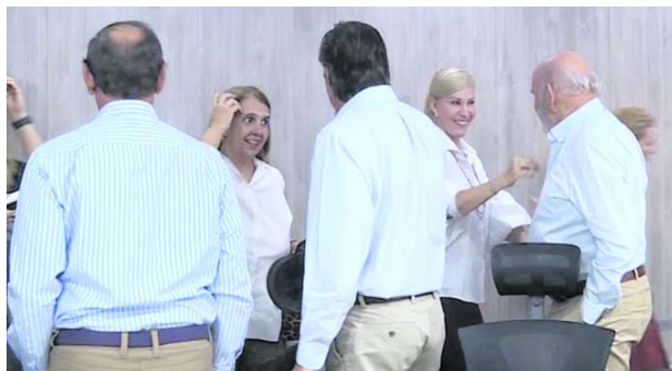
El gobierno del Valle y Asocaña se reunieron para hablar sobre proyectos comunes.

niños puedan comer su alimentación escolar caliente, con mejor calidad en sus escuelas y colegios”.