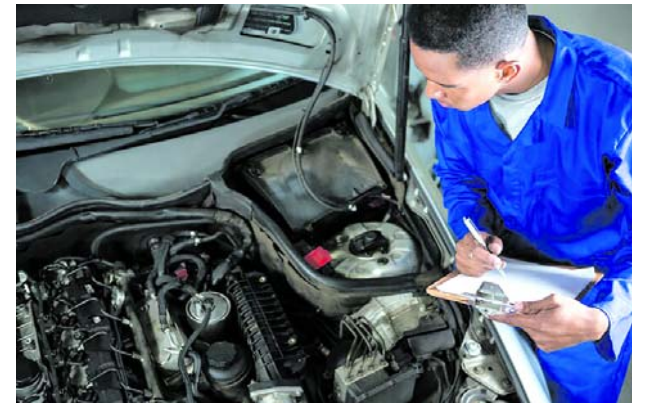
Propietarios de vehículos enfrentan nuevos costos en Colombia para cumplir con requisitos de circulación en el 2024.

En el corazón de esta joya arquitectónica, el interior de la estación deslumbra con una excelente iluminación generada por múltiples puertas estratégicamente ubicadas a lo largo de sus paredes. Este diseño no solo mejora la funcionalidad del espacio, sino que también crea una atmósfera acogedora y agradable para quienes transitan por ella. Además, la Plazoleta Exterior, adornada con la representación artística de la Rosa de los Vientos, añade un toque simbólico y distintivo a este Patrimonio Arquitectónico Nacional. Esta construcción no solo es un punto de referencia histórico, sino también un testimonio vivo de la rica herencia cultural que perdura en la región.