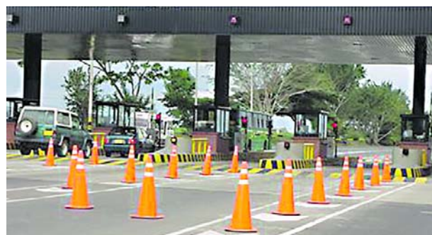
Los peajes comenzaron a aplicar las nuevas tarifas en el Valle.