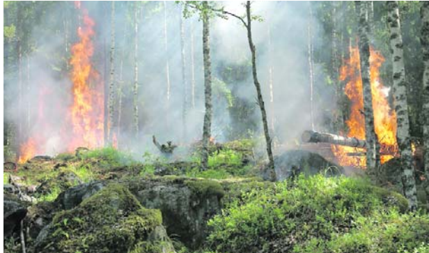
Los incendios forestales preocupan durante esta temporada seca.

La entidad hizo especial énfasis en la zona andina.