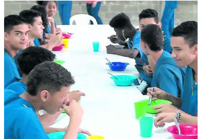
Los estudiantes que regresan a clase tienen garantizada la alimentación escolar.