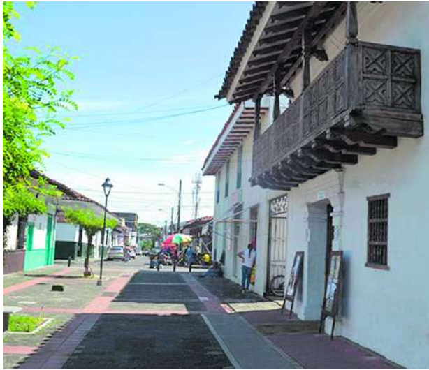
Los alcaldes de Cartago, Dagua y Tuluá, han recibido amenazas.

El mandatario afirmó que recibió amenazas en su contra y de su familia vía WhatsApp y denunció que a través de mensajes intimidatorios enviados a miembros de su familia, desconocidos le exigen que deje su cargo y se vaya de la ciudad, junto a