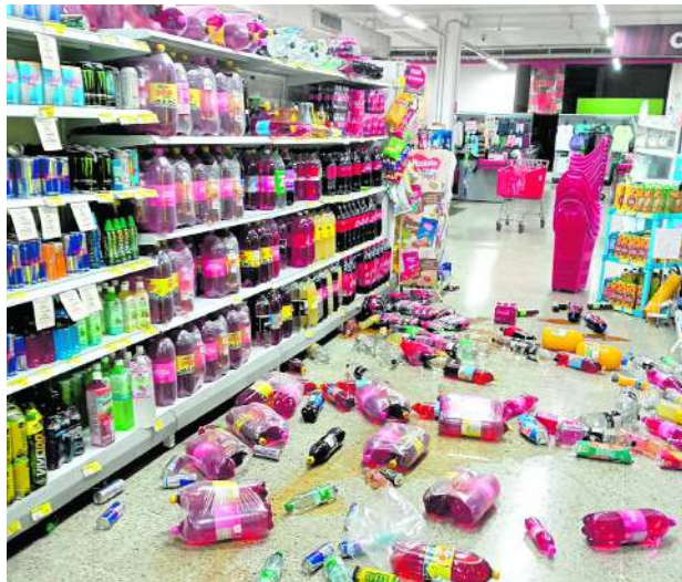
En el supermercado La Montaña, el temblor dejó daños menores.

"Hasta el momento, desde la Secretaría de Gestión de Riesgos, despachamos un equipo hacia El Águila que ha sido uno de los municipios afectados en algunas viviendas y especialmente en el hospital local se presentaron algunos agrietamientos en su estruc-