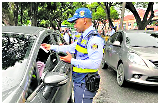
El gobierno caleno dio a conocer el Decreto del pico y placa.

Así mismo, a partir del lunes 29 de enero, la sanción