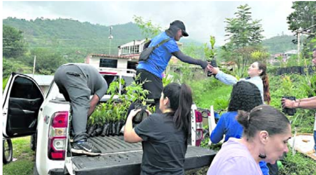
privada y los comités ambientales del comité ambiental del cor- La CVC ha sembrado más de mil árboles en Cali durante las últimas semanas.

tales Montebello y El Chocho, la CVC sembró 850 árboles de especies como flor amarillo, chirlobirlo, guayacán lila, gualanday y guayaba roja, los cuales fueron producidos en nuestro vivero de San Emigdio.