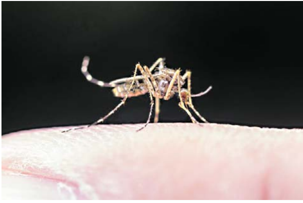
Una medida crucial fue la recapacitación del personal de salud en el manejo específico del dengue, centrándose en los signos de alarma