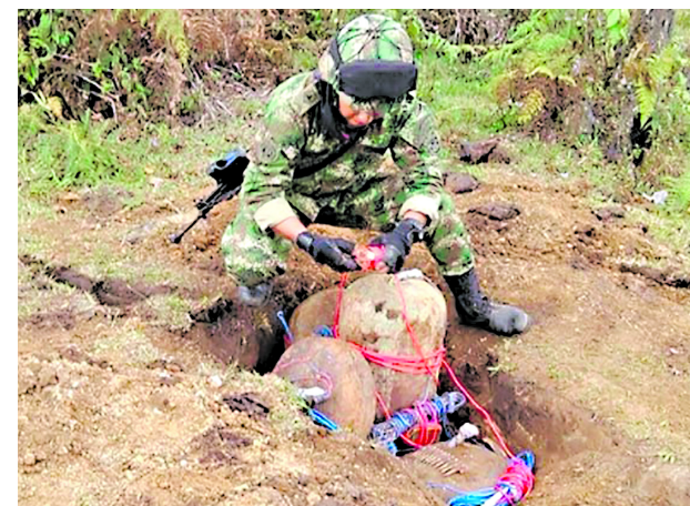
Los hechos se presentaron en zona rural de López de Micay.

deberán certificar la vigencia de su personería jurídica con fecha no superior a tres meses, presentando el acta de reunión en la que se efectúa la postulación y documento explicativo que contenga la información suficiente sobre las actividades realizadas por la organización postulante.