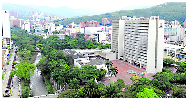
El gobierno de Cali convocó a la renovación del Consejo Municipal de Planeación.

Territorial de Planeación serán seleccionados y designados por el primer mandatario de las ternas de las organizaciones jurídicamente reconocidas de los diferentes sectores, conforme a los requisitos del Acuerdo Municipal 01 de 1995.