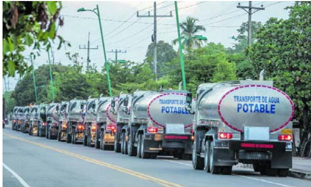
40 nuevos carrotanques , con capacidad de 16,000 litros cada uno, entregados por la UNGRD se busca garantizar el suministro de agua en La Guajira.

Es importante resaltar que, para mejorar la planificación de la distribución del recurso hídrico, desde hoy todo el suministro de agua se canalizará a través del Ejército Nacional de Colombia. Este se encargará de realizar la capacitación del manejo de los carrotanques