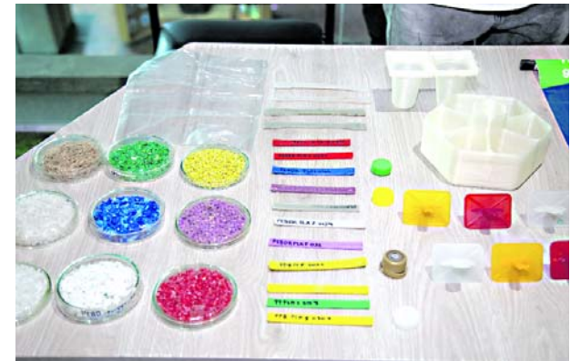
Con la firma del memorando se busca adelantar acciones para evitar la contaminación por plástico.

Así mismo, se plantaron individuos de carbonero rojo, guayacán rosado, guayacán amarillo y gualanday, con el fin de atraer fauna. Muchos de estos animales son polinizadores y dispersores de semillas: aves, mamíferos, mariposas y abejas.