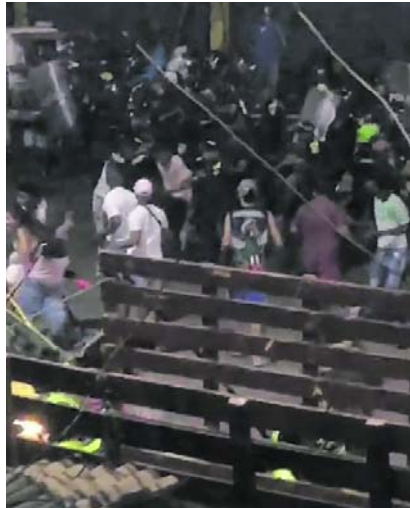
Autoridades intervienen tras enfrentamientos durante controles de movilidad.

ciudadanía, al cumplimiento de las normas de tránsito, al respeto y al respaldo a las autoridades, los operativos se seguirán desarrollando", afirmó el coronel Oviedo. También subrayó la importancia de colab-