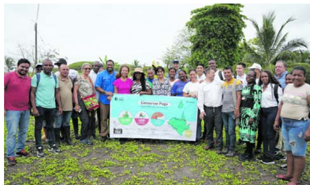
Un total de 2.300 familias en el Pacífico se verán beneficiadas con el programa "Conservar Paga".

El programa entregará incentivos económicos para desarrollar estrategias que impulsen las economías