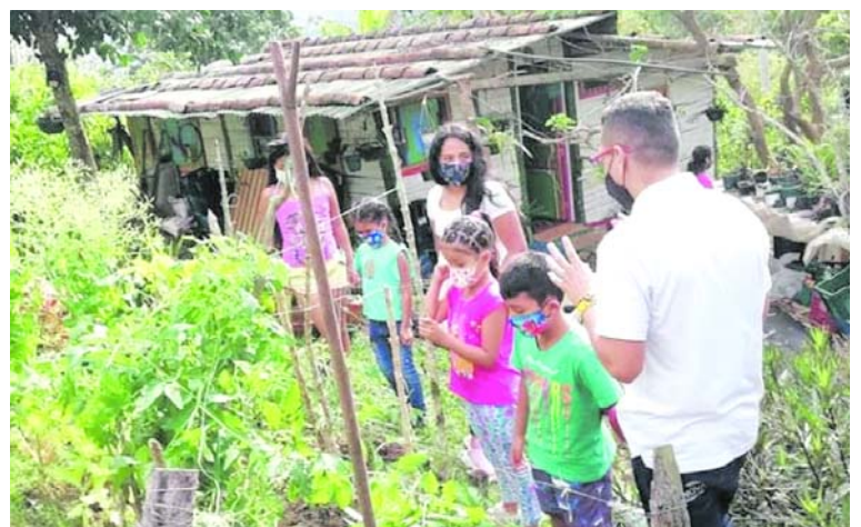
Sembrando conocimiento en el Corregimiento Santa Inés Yumbo: educando a niños sobre plantas, huertos caseros y el amor por la naturaleza.