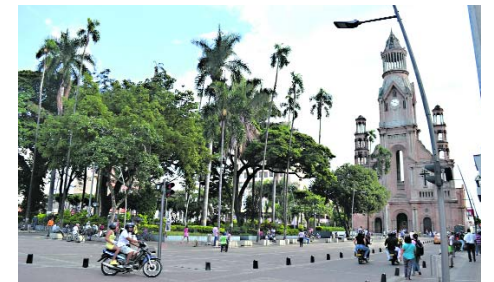
Un menor murió en Palmira luego de quedar en medio de una balacera.

Ramos manifestó que “he dado instrucciones directas al Secretario de Seguridad de actuar con mano dura ante estas situaciones. Estamos trabajando incansablemente y de manera articulada con las autoridades del municipio para lograr el esclarecimiento de este hecho”.