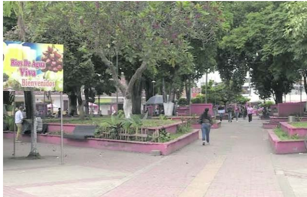
Un piloto de seguridad para Jamundí y el norte del Cauca le pidió la gobernadora del Valle al Alto Comisionado de paz.

La mandataria explicó que el Comisionado de Paz se mostró muy interesado en dicha propuesta y que “incluso, me dijo que la próxima semana estaría viniendo a Cali para hablar del tema con la alcaldesa de Jamundí, con la mesa campesina, y con la comunidad para lograr este propósito de recuperar el control territorial con las instituciones en la zona rural y alta