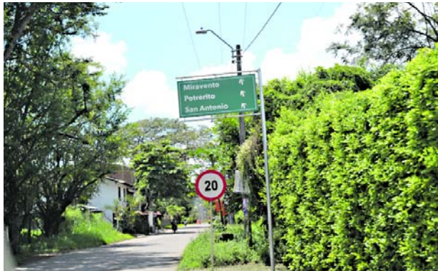
Hay temor en Jamundí por la aparición de pancartas alusivas a las disidencias de las Farc.

Sin embargo, tenía la imagen del desaparecido comandante de las Farc Alfonso Cano y detrás de la pancarta, acompañado de un mensaje escrito