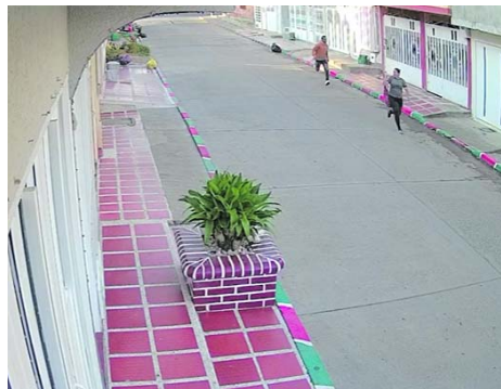
El momento en que la mujer era perseguida quedó grabado en un video.

La funcionaria dijo que “rechazamos profundamente estos hechos, nos solidarizamos con las familias de las víctimas y pedimos justicia, estos casos tan aberrantes no pueden