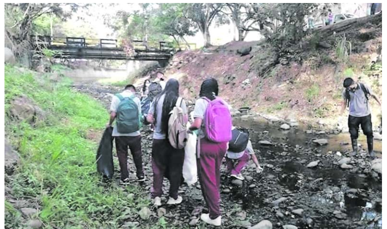
Limpieza al río Yumbo con la Institución Educativa Antonia Santos con alumnos de 10 y 11.