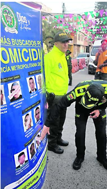
Alias 'Mini' había sido parte del volante de 'Los Más Buscados' por homicidio en el oriente de Cali.

'Mini', en particular, había sido parte del volante de 'Los Más Buscados' por homicidio en el oriente de Cali, y previamente