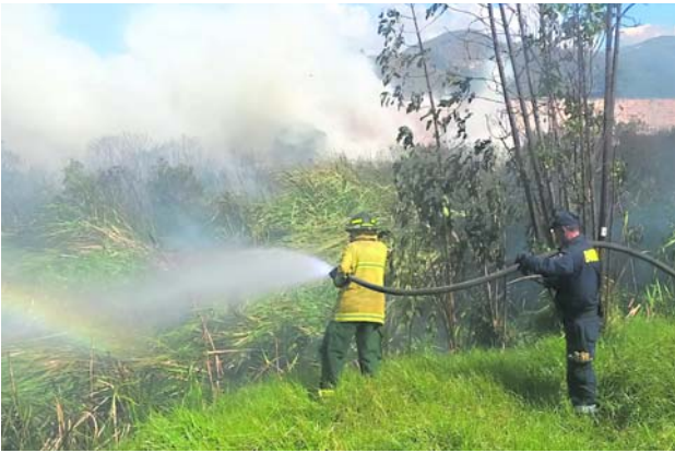
El jefe de Estado anunció que se activaron los protocolos para buscar ayuda internacional, incluida las Naciones Unidas.

En un llamado a la solidaridad internacional, el presidente informó que se han activado todos los protocolos para buscar ayuda externa. "Vamos a pedir apoyo a las Naciones Unidas; hay un protocolo para ello, en el día de hoy se activa", declaró Petro. Con más de 600 hombres entrenados y recursos aéreos en acción, el Gobierno busca garantizar la capacidad física necesaria para hacer frente a la creciente crisis.