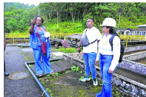
Personal de la Alcaldía Distrital de Buenaventura visitó la bocatoma del acueducto..

En medio de la creciente preocupación por el fenómeno de El Niño y su impacto