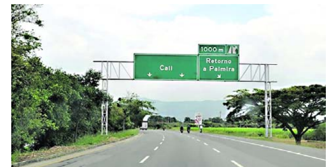
La recta Cali - Palmira será iluminada para mejorar la seguridad.

Ramos manifestó que “tenemos también la terminación de la carrera primera, la nueva vía de la Universidad Nacional hasta el puente del Sur; la nueva vía a la Herradura y la que va a Matapalos. Estamos demostrando a las demás regiones que trabajando unidos podemos lograr