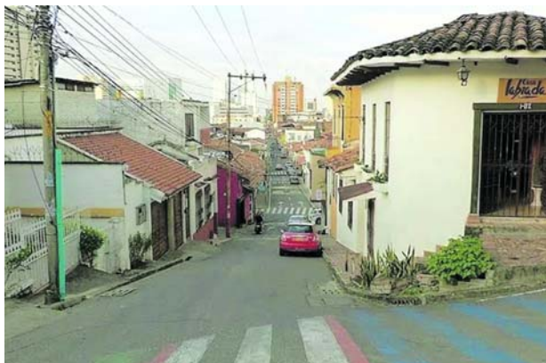
Cali fue candidatizada como sede de la COP16.

El funcionario indicó que en el encuentro “resaltamos tres cosas: lo primero el compromiso tanto del Alcaldía como de la Gobernación de financiar parte del evento; segundo, las capacidades que