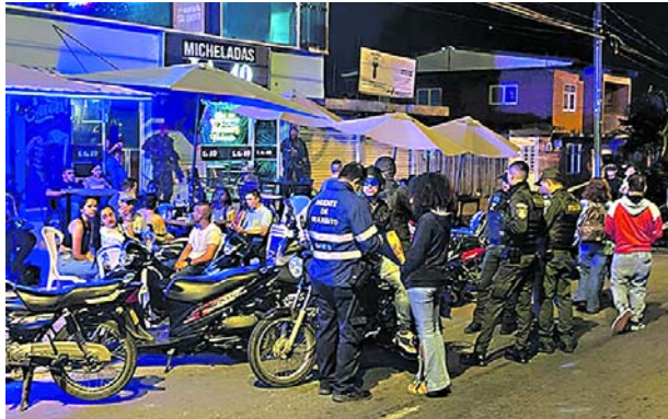
La fuerza pública adelanta operativos tanto en las calles como los establecimientos de nocturnos en Tuluá.

Por otra parte, en el municipio de Tuluá, la Policía