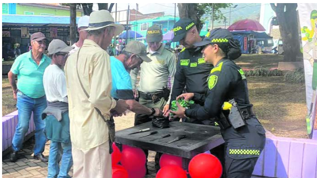
En el parque de Calima Darién la Policía intercambiaba dulces por armas blancas.

mente sus elementos, y a cambio la policía les regaló un dulce, como insignia por su compromiso contra la violencia.