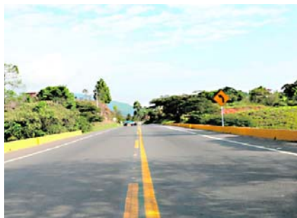
La vía Panamericana entre Cali y Popayán fue nuevamente bloqueada por protestas.

Mientras se realizaban los diálogos, para reforzar el punto del bloqueo, las comunidades indígenas Misak hicieron que los trabajadores que adelantan la