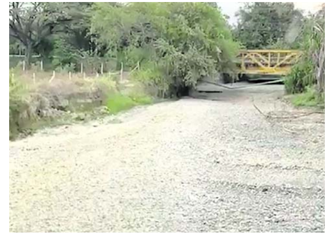
Así se encuentra el cauce del río Guabas en la parte baja de Guacarí.

También se dotó a los hospitales del antígeno para el dengue.