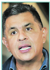
Jorge Iván Ospina

Para esta misión, bastante compleja —pues las reformas generan mucha desconfianza—, el presidente necesita contar con ministros que tengan buena interlocución con el Congreso y/o ministros que representen votos, es decir, que tengan una bancada detrás.