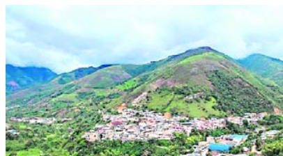
Sigue la preocupación en Argelia por los combates que se presentan desde hace tiempo.

Sin embargo, la comunidad expresó que fueron minutos de pánico que los obligó a refugiarse en sus viviendas.