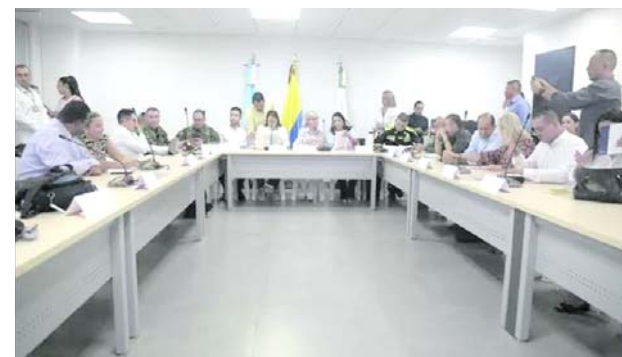
En Buga se realizó ayer un consejo de seguridad para combatir la extorsión y la criminalidad.

Es de anotar que 300 policías llegaron para prestar sus servicios en el área metropolitana de Cali y los 200 uniformados que llegan reforzar la seguridad en otros municipios del Valle del Cauca.