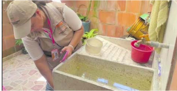
Tomar precauciones para evitar la reproducción del mosquito transmisor del dengue solicitó a los vallecaucanos el gobierno departamental.

agua limpia, lavemos los tanques y cambiemos el agua de los floreros, para evitar la reproducción del zancudo. Así mismo, debemos utilizar repelente y en caso de presentar fiebre mayor a 39 grados por más de tres días, vómito o sangrado, acudir inmediatamente al médico”.