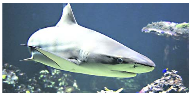
Una investigación permitió descubrir una red que traficaba ilegalmente aletas de tiburón.

Así mismo, la voz advierte que quien no se sume a su causa, asumirá las consecuencias.