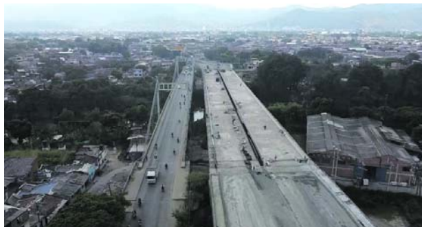
El plan de choque en el sector del puente de Juanchito se mantiene para garantizar la movilidad.

puestas dos grúas que estarán permanentemente en el sector como parte del plan de choque para garantizar la movilidad, en caso de que los automotores que transitan por el puente de Juanchito y la vía Cali-Candelaria, presenten fallas.