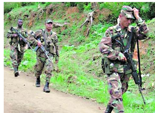
El Ejército denunció presiones de las disidencias de las Farc a la comunidad para que expulsen a los uniformados en Buenos Aires.

Los mandatarios se reunieron recientemente con el representante del Banco.