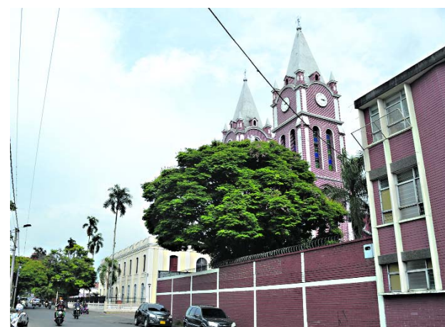
Sigue el temor en Tuluá por las amenazas de los grupos criminales.

Otra de las acciones en esta vía son las obras de bacheo adelantadas en el sector de Juanchito por la Secretaría de Infraestructura del Valle para mejorar la movilidad por este sector.