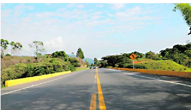
Nuevamente, la vía Panamericana entre Cali y Popayán es bloqueada por cuarta vez este 2024.

El dirigente gremial indicó que este tipo de acciones generan pérdidas al sector por