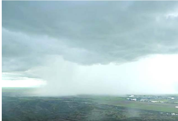
A pesar de que el fenómeno de El Niño sigue, se presentan algunas lloviznas por estos días

Región Andina se esperaban ayer cielos parcialmente cubiertos con lluvias ligeras alternadas con periodos secos durante el día y en horas de la noche.