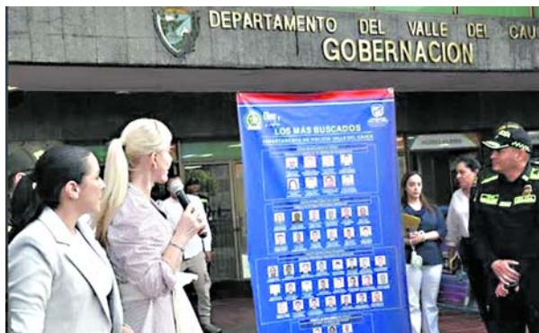
La acción de la fuerza pública ha permitido la captura de varios de los más buscados en el Valle.