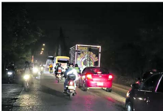
El laboratorio vial por el puente de Juanchito se inicia muy temprano en la mañana.

ratorio más temprano, esto nos va a ayudar a que de aquí a las 6:00 de la mañana hayamos desalojado cerca del 60% de los vehículos que transitan por esta zona”.