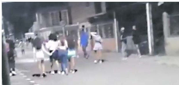
En estos encuentros violentos participan niños menores de 12 años, incluso las niñas están involucradas en esconder armas durante estos encuentros

que participan en estas prácticas violentas.