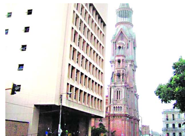
El gobierno de Palmira gestiona con la SAE varios de sus inmuebles para impulsar programas sociales.