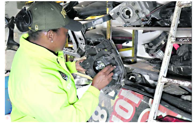
Policía Metropolitana de Cali

Las víctimas fueron liberadas al día siguiente del secuestro gracias a las presiones ejercidas por las autoridades.