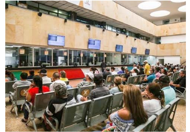
Los contribuyentes tienen plazo de pagar los alivios tributarios departamentales hasta el 29 de febrero.

Así mismo se espera una temperatura mínima de 19 grados centígrados y una máxima de 31 grados centígrados.