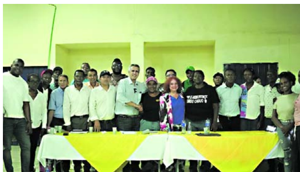
El Ministro del Interior, Luis Fernando Velasco, se reunió con la Asociación de Consejos Comunitarios del Norte del Cauca.

“porque es evidente que a las comunidades afro desde tiempo atrás se les han venido haciendo una serie de ofrecimientos que no se han concretado”.