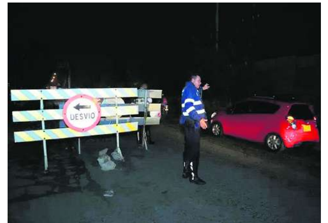
Avanza con éxito el laboratorio vial implementado en el puente de Juanchito.

En la zona se encuentran treinta agentes de las secretarías de Movilidad del Valle, Cali y Candelaria, quienes se distribuyen a lo largo de un kilómetro para controlar el