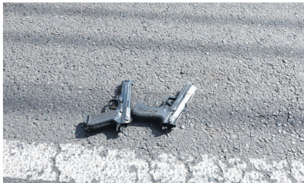
Como resultado de la confrontación, uno de los delincuentes fue neutralizado, mientras que otro resultó herido.

Como resultado de la confrontación, uno de los delincuentes fue neutraliza-