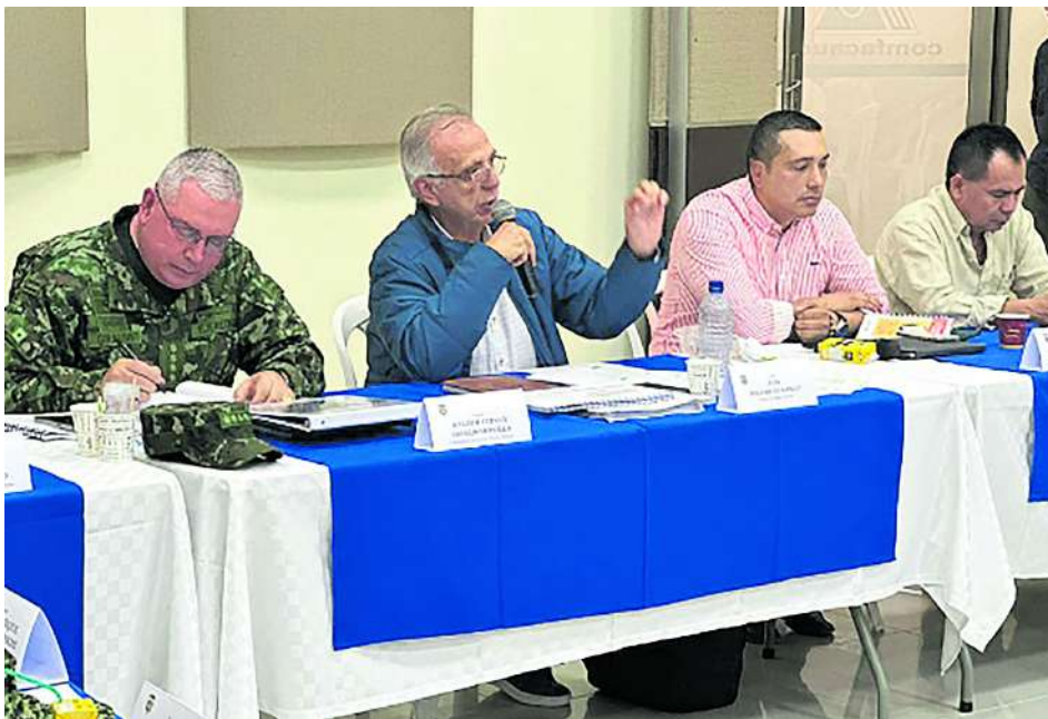
El Ministro de Defensa, Iván Velázquez, presidió un consejo de seguridad en el Cauca.