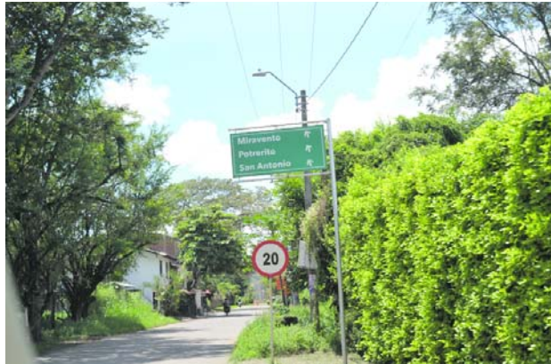
Las autoridades han denunciado retenes permanentes de las disidencias de las Farc en zona rural de Jamundí.

conocimiento a través de redes sociales, de un supuesto retén de la estructura Jaime Martínez de las Farc" pero que no hay una denuncia oficial al respecto.