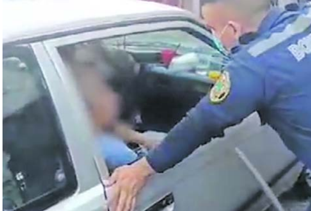
La víctima, una mujer de 89 años, presuntamente estaba siendo sometida a abusos físicos y verbales por parte de dos familiares.