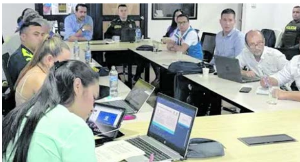
Quedó listo el Plan de Acción Específico para la Recuperación para la atención oportuna de situaciones generadas por el Fenómeno de 'El Niño'.

Desastres del Valle, indicó que las líneas de intervención son: asistencia humanitaria y apoyo a los entes o entidades de socorro del departamento, y agua potable y saneamiento básico, que consiste en el suministro de agua potable en carrotanques ante una posible un