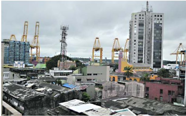
El modelo de paz de Buenaventura podría replicarse en otras ciudades de Colombia.

primera fase a través del torneo de 'Fútbol para la paz' concluyó con la participación de 1.600 jóvenes que atendieron de manera entusiasta el llamado, como también la continuidad en la tregua de los 'Shotas' y los 'Espartanos'.