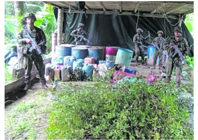
Unos siete laboratorios clandestinos fueron destruidos por la Armada en el Pacífico.

Según Monseñor Jaramillo, gran parte del país necesita este tipo de diálogo y de intervención como el que se viene aplicando en Buenaventura, donde las muertes en las calles han disminuido en forma considerable.