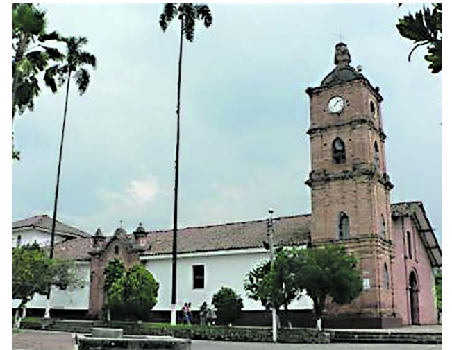
En Caloto se presentó una asonada contra el Ejército.

Ante esta situación, los líderes sociales del Cauca reiteraron a las autoridades y al gobierno nacional una mayor protección.