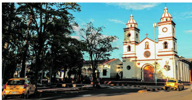
En zona rural de Santander de Quilichao fue asesinado un líder social.