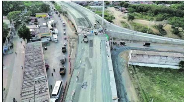
Avanzan las obras del puente de Juanchito y sus accesos para lo cual se trabaja en once frentes.

cumplir un hito fundamental que es habilitar lo antes posible la calzada norte”.