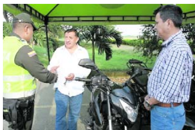
Las autoridades lograron la recuperación de tres motos de alto cilindraje hurtadas en la recta Palmira-Cali.

Este logro fue posible gracias al arduo trabajo de investigación y seguimiento llevado a cabo por la Policía Nacional y la Secretaría de