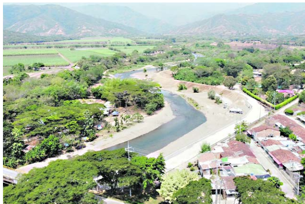
La CVC hizo entrega de un dique que protege a cuatro barrios de Riofrío contra inundaciones.

La CVC hizo entrega a los habitantes de Riofrío de estas obras que controlan la erosión