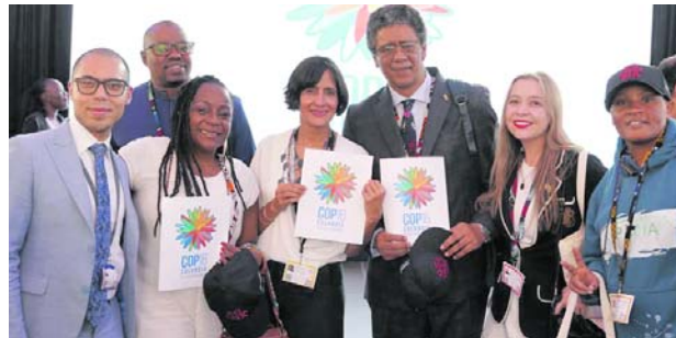
La imagen elegida para representar la COP16 está inspirada en la flor de Inírida, una especie endémica de Colombia.

La imagen elegida para representar la COP16 está inspirada en la flor de Inírida, una especie endémica de Colombia. Esta imagen no solo simboliza la biodiversidad única del país, sino que también incorpora las 23 metas de biodiversidad establecidas por la ONU en el Marco Mundial