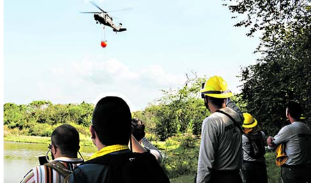
Entre las acciones destacadas ante el Concejo se encuentran la capacidad operativa del Cuerpo de Bomberos y el uso del sistema Bambi Bucket.