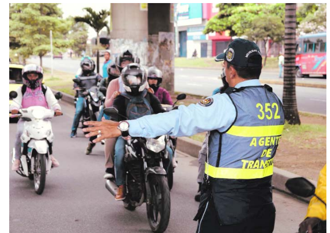
Algunas personas intentaron evitar la inmovilización y agredieron a los operarios de las grúas

Este evento internacional, que se llevará a cabo en Cali, Colombia, del 21 de octubre al 1 de noviembre de 2024, será una oportunidad crucial para discutir y tomar medidas concretas para abordar los desafíos ambientales globales.