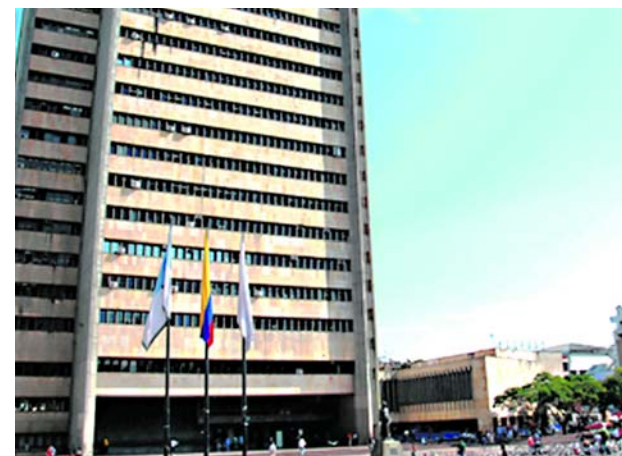
El gobierno departamental recordó a quienes se acogieron a los alivios tributarios del 2023, que hoy vence el plazo.

Este éxito refuerza la importancia de la colaboración entre la comunidad y las autoridades locales en la lucha contra el crimen y la recuperación de bienes robados, así como la eficacia de las estrategias como P.U.M.A.S. que lucha contra el hurto de motocicletas y el comercio de autopartes robadas en esta ciudad, para la cual ha sido importante la colaboración de la comunidad.