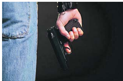
Al correr en direcciones opuestas, lograron desorientar a los asaltantes y escapar sin sufrir ningún daño.

Este incidente resalta la importancia de mantenerse alerta y tener un plan de acción en caso de encontrarse en una