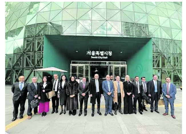
Continúa la intensa agenda de la gobernadora del Valle, Dilian Francisca Toro, en Corea del Sur.

Además, recordó que la gobernadora Dilian Francisca Toro, hizo ante el Gobierno Nacional la solicitud del Batallón de Alta Montaña para Jamundí.