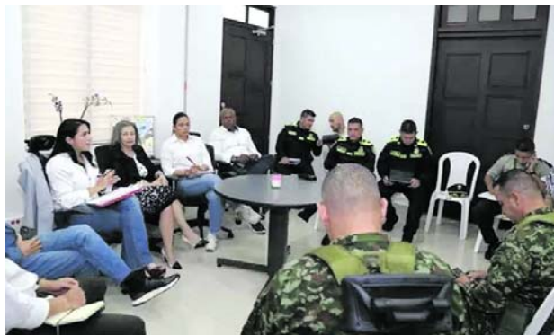
En un consejo de seguridad realizado en Jamundí se determinó la llegada de más pie de fuerza del Ejército.