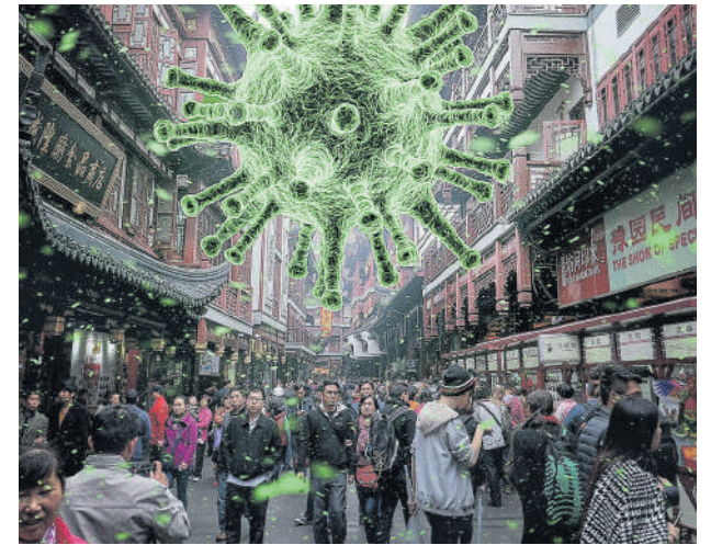
La humanidad debe prepararse para nuevas pandemias que se puedan presentar en el futuro.

En el siglo XXI, el mundo fue testigo de dos brotes de coronavirus, el Síndrome Respiratorio Agudo Severo