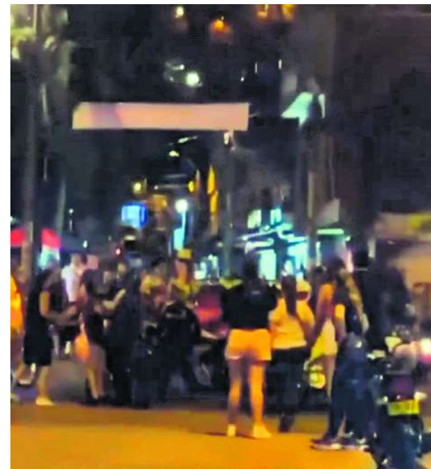
Las imágenes revelan expresiones de inconformidad por parte de algunos ciudadanos, subrayando la resistencia de ciertos sectores a estas medidas.

Otra usuaria comparte, "veo a muchos enojados porque les están poniendo orden en la movilidad y les enseñan a respetar el rojo de los semáforos, al peatón, a tener los documentos al día. Algunos están enojados porque les están enseñando