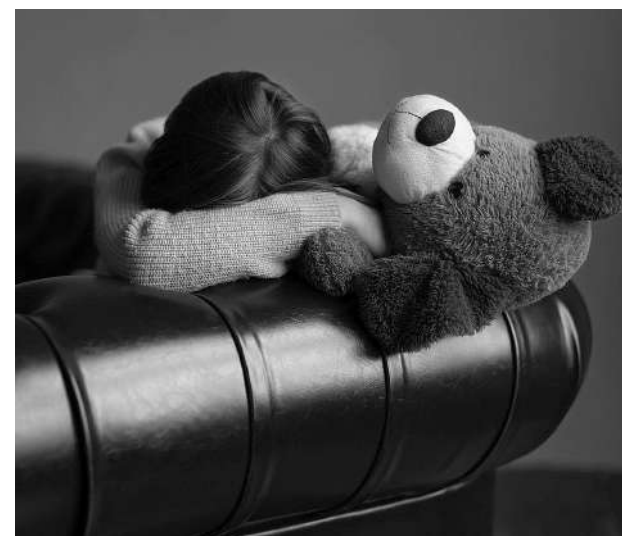
El ahora culpable del feminicidio agravado deberá cumplir una condena de 416 meses de prisión, equivalente a 34 años y 7 meses tras las rejas

Sin embargo, la condena inicial de 340 meses, es decir, 28 años y 4 meses, por homicidio