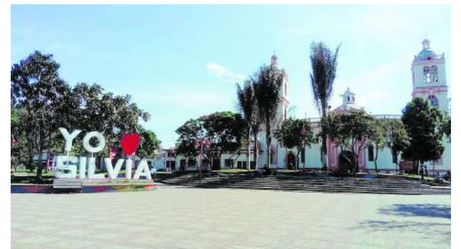
En el Valle se han presentado en las últimas semanas 60 incendios forestales.