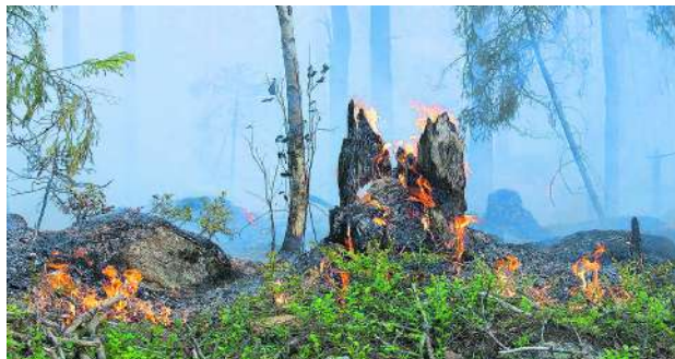
Diversas instituciones en el Valle trabajan unidas para prevenir los incendios forestales.

Durante el presente mes la Fuerza Aeroespacial viene intensificando los operativos para evitar dichos incendios ante la predicción del Instituto de Hidrología, Meteorología y Estudios Ambientales, Ideam, que indica que en este mes de febrero se registrarán mayores