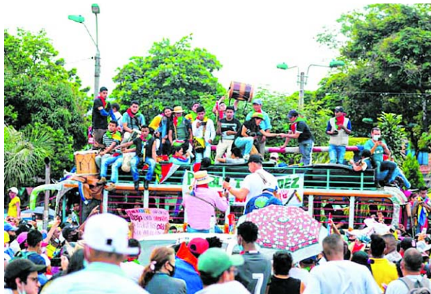
Las comunidades indígenas han anunciado movilizaciones durante tres días.

A estas marchas se vincularían organizaciones indígenas de los departamentos de Putumayo, Huila, Nariño,