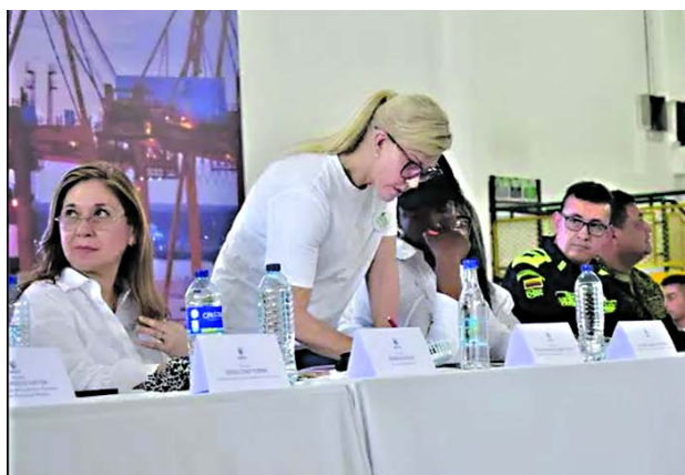
La gobernadora Dilian Francisca Toro firmó el Acuerdo Interinstitucional que permitirá regular las prácticas mineras ancestrales en 11 municipios del departamento.