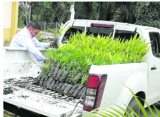
En el vivero San Emigdio de la CVC se cultiva la palma de areca.

Así mismo, agregó que "el Pueblo Misak lleva más de quince años que no se les han comprado tierras, y vemos con preocupación que se han firmado acuerdos, y este Gobierno y anteriores no los están cumpliendo". Además, el líder indígena señaló que a otras organizaciones sociales si les están comprando tierras, mientras que, a los Misak no lo han hecho hasta ahora.