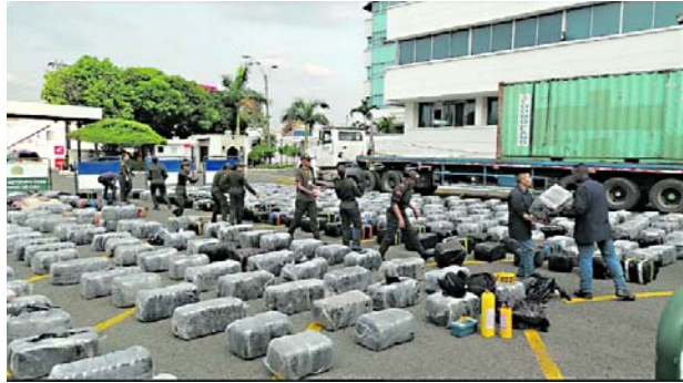
Se incautaron 5.6 toneladas de marihuana que iban a ser distribuidas en el mercado local, lo que representa cerca de 2.000 millones de pesos.