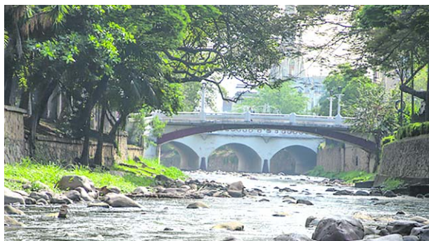
Gracias a la interconexión de las redes alta y baja, se logró mantener el suministro, aunque con una baja presión en algunas zonas.

La red alta se surte del río Cali, desde la planta de tratamiento de San Antonio, y del río Meléndez, desde la planta La Reforma. Mientras tanto, la red baja toma el agua del río