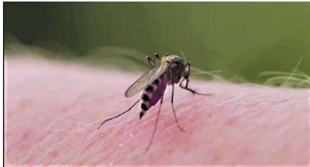
Los casos de dengue se han incrementado en el Valle del Cauca.

año, una cifra muy importante que indica que tenemos una epidemia que está sobre los límites medio de lo calculado”.