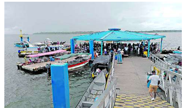
El mejoramiento del muelle turístico es una de las iniciativas planteadas por los habitantes de Buenaventura.

La mandataria dijo que “todas las personas lo pueden prevenir con cosas sencillas como no tener agua limpia estancada en la casa, si duermen al aire libre utilizar toldillo o usar repelente”.