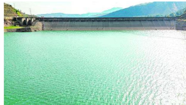
El embalse de Salvajina tiene garantizado el suministro de agua para Cali.

La Secretaría de Seguridad lidera Puesto de Mando Unificado, mientras que la Secretaría de Paz y Cultura Ciudadana está en permanente diálogo con los líderes de la minga.