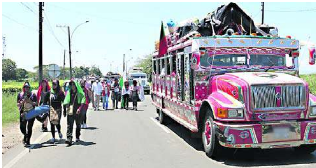
La minga indígena tiene previsto reunirse con el presidente Gustavo Petro en Cali.

tarían, para este viernes desplazarse hasta Puerto Rellena.