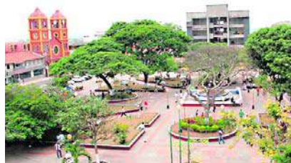
El bajo caudal del río Yumbo ha obligado a la Espy a tomar medidas.

Además, indicaron que el caudal del río ha disminuido aproximadamente en