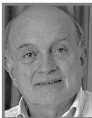
GUSTAVO ÁLVAREZ GARDEAZÁBAL