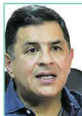
Jorge Iván Ospina

Y como hace un par de semanas el alcalde de Medellín, Federico Gutiérrez, presentó un informe sobre las condiciones en las que la administración de Daniel Quintero le entregó la Alcaldía, la expectativa por conocer el "libro blanco" de Cali aumentaron.