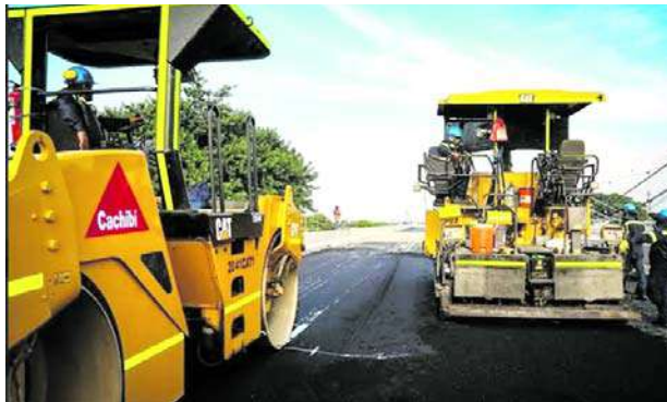
Una vez terminado el pavimento sobre la calzada norte del nuevo puente de Juanchito, será habilitada a los usuarios de la vía.

“vamos a dar vía por la calzada norte y eso va a mejorar un poco la movilidad, pero la idea es terminarlo todo más o