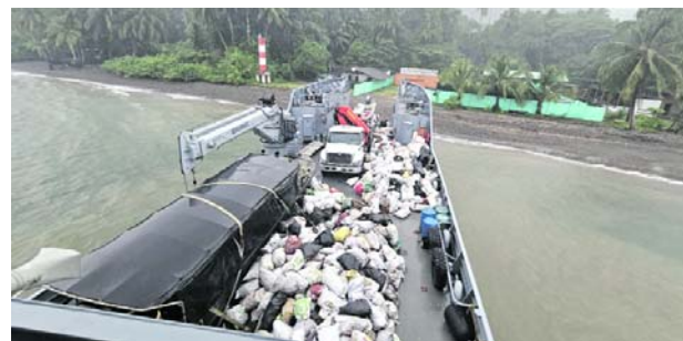
Los residuos fueron trasladados por la Armada a Guapi y Buenaventura

Con el fin de atender el requerimiento realizado por Parques Nacionales Naturales de Colombia la Institución