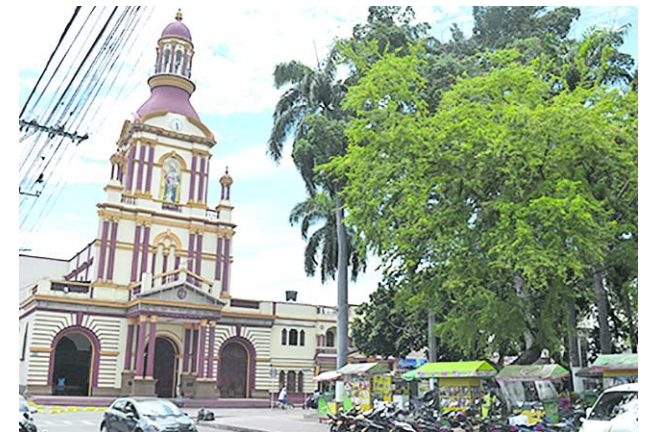
La Alcaldía de Candelaria determinó adelantar varias acciones para controlar el brote de varicela y que no se expanda en el municipio.

Bruce Mac Master, presidente del Consejo Gremial, pidió al Gobierno "concentrarse en la real construcción de consensos sobre los temas más importantes de nuestra sociedad, como son la equidad, la superación de la pobreza, la sostenibilidad del sistema de salud, la garantía de atención a pacientes, el control del territorio por parte del Estado, la seguridad ciudadana y la reactivación económica".