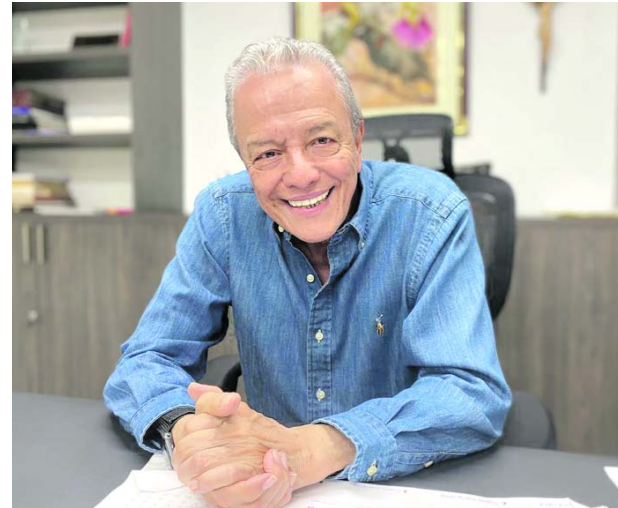
El analista político Miguel Yusty sostiene que está en marcha un plan para que el presidente Gustavo Petro se quede en el poder.

gobierno a todos estos grupos armados ilegales está unido de alguna manera a la agenda de Petro, porque la llamada paz, obviamente, apunta, ante la devastación que hizo de todos los cuadros de las Fuerzas Militares, a encontrar una serie de apoyos que se los brinda el conflicto armado, que esa es la diferencia con Venezuela, allá no tenían conflicto armado y Chávez tuvo que crear los comandos bolivarianos, aquí no hay necesidad, Petro tiene eso, entonces, todo ese contexto de un estado nacional fracturado es uno de los elementos de la agenda de Petro.