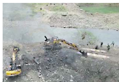
Esta es la maquinaria amarilla destruida por la Fuerza Pública en Guapi.