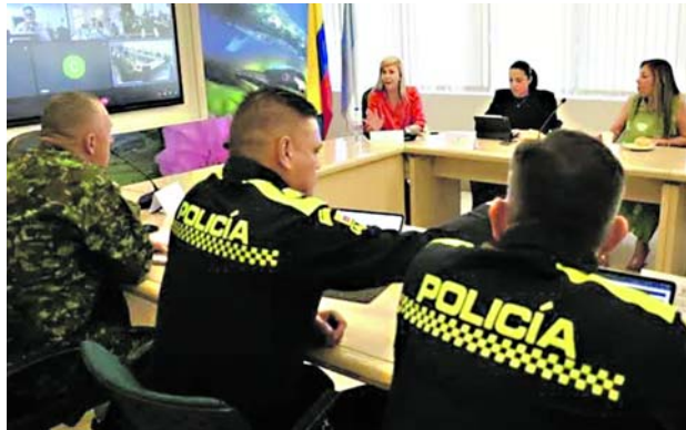
Se realizó un consejo de seguridad en la gobernación del Valle ante la suspensión de diálogos con las disidencias de las Farc.

Durante la operación se encontraron tres excavadoras, cuatro motores industriales y dos motobombas las cuales fueron inutilizadas de acuerdo a los protocolos establecidos por las autoridades competentes.