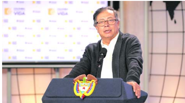
El presidente Gustavo Petro enfatizó en la realización de una Asamblea Constituyente.

empresariales de Colombia, la convocatoria de una Constituyente, genera un ambiente de incertidumbre e inestabilidad.