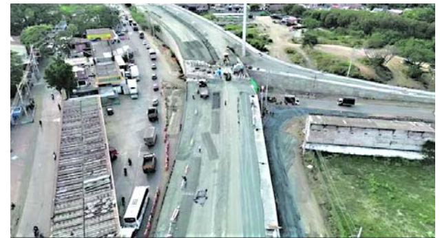
La comunidad de Juanchito y Candelaria se beneficia con los servicios ofrecidos por el gobierno departamental.

Igualmente, invitó a la ciudadanía a denunciar y prevenir cualquier acción delictiva para garantizar la tranquilidad de todos los vallecaucanos.