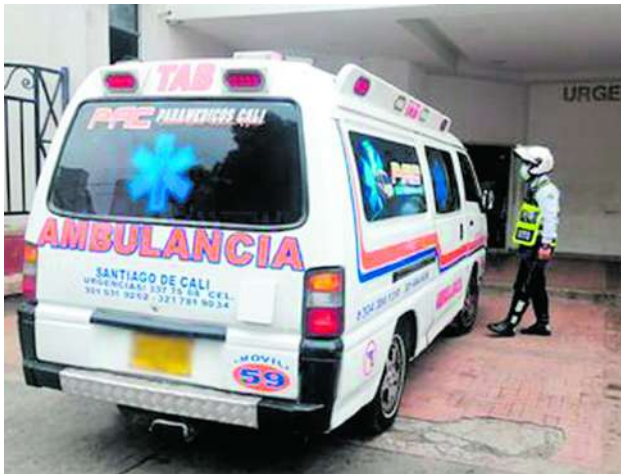
Escobar hizo hincapié en que las ambulancias no están exentas de cumplir con las leyes de tránsito