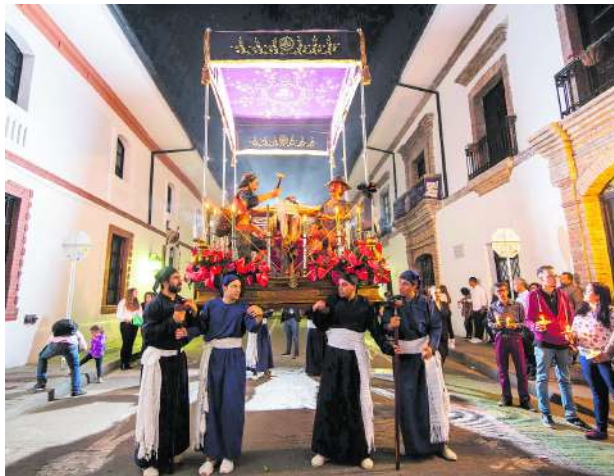
Hay preocupación en Cauca por posibles bloqueos a vía Panamericana en Semana Santa.

Los gremios han hecho un llamado al Gobierno nacional para que tome acciones enmarcadas por la Constitución y la ley y se evite que sigan presentándose blo-