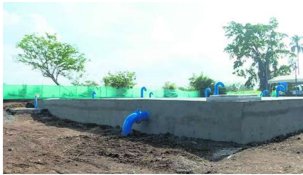
La construcción de nuevos tanques de almacenamiento en Bugalagrande y Andalucía mejorará el servicio de acueducto.