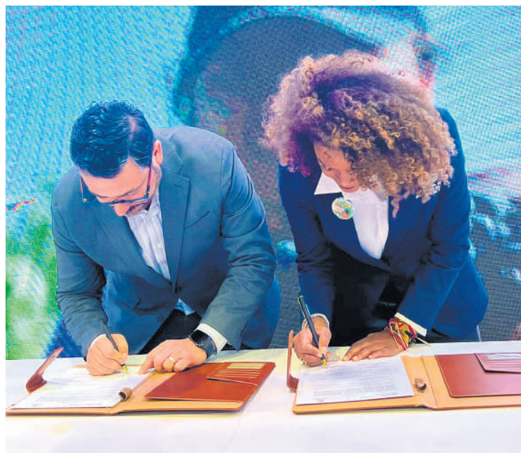
Este acuerdo es un paso significativo hacia la promoción de Cali como un destino turístico vibrante y acogedor para visitantes de todo el mundo.

alianza surge durante la destacada participación de Cali en Fitur, España, con un propósito firme: fortalecer la imagen de Cali como auténtica ‘Ciudad Creativa’.