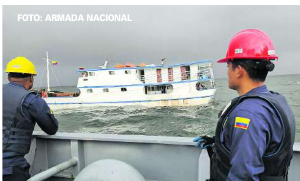
La motonave fue atendida por la Armada en el área de Isla GorgoNa. Llevaba 25 personas a bordo.

En un trabajo de rescate, el buque de desembarco anfíbio ARC “Bahía Solano” de la Fuerza Naval del Pacífico escuchó el llamada de auxilio