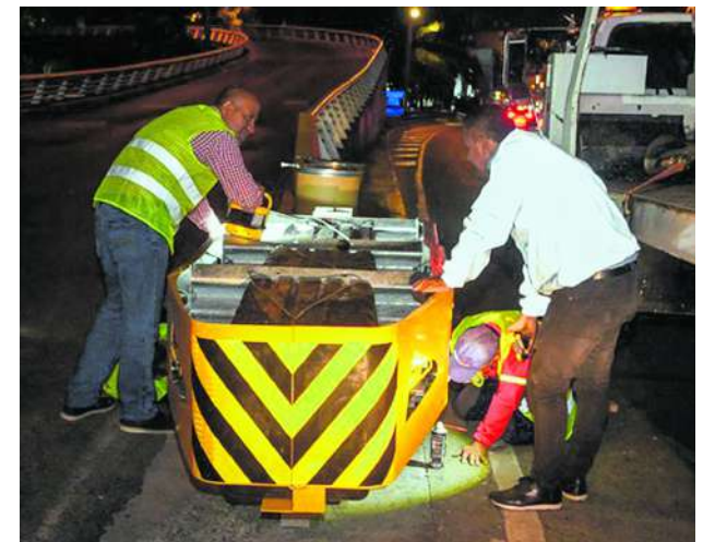
Fueron instalados en la calle 5 con carrera 10 y en la carrera 1 con calle 25, lugares donde se registraron maniobras peligrosas y divisiones viales.

Desde la Secretaría de Movilidad Distrital, se instó a los conductores a respetar los límites de velocidad establecidos, recordando que la velocidad máxima permitida en el perímetro urbano es de 50 kilómetros por hora. Esta medida tiene como objetivo prevenir accidentes viales y proteger la vida de todos los ciudadanos que transitan por las calles de Cali.