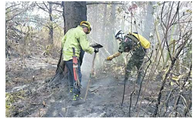
El Ejército se unió con herramientas manuales a sofocar el incendio en Yumbo.

Como se recordará, el asesinato de una líder indígena y el ataque contra la población civil en el municipio de Toribío fue la razón por la cual el presidente Gustavo Petro anunció la suspensión del cese al fuego en el suroccidente colombiano.