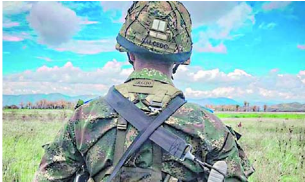
La Fuerza Pública ha incrementado sus operaciones en el departamento del Cauca.