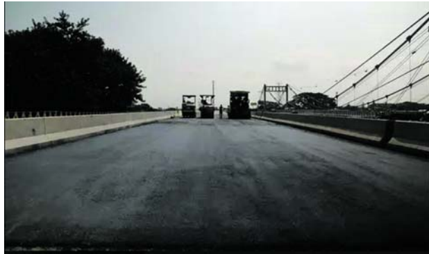
La calzada norte del nuevo puente de Juanchito está lista para su habilitación.