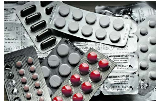
Hay alerta por la escasez de medicamentos en todo el país.

Ramírez agregó que, desde el lado de Cali, “tenemos ya el empalme con la doble calzada, para entregar el tráfico hacia la carrera octava en Cali; de igual forma, un acceso exclusivo para la galería de ‘Alfonso López’”.