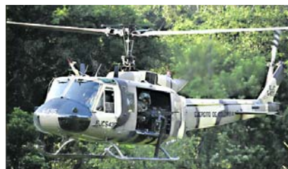
En zona rural de Putumayo se registraron combates entre Ejército y disidencias de las Farc.

El presidente Gustavo Petro, quien levantó mediante decreto el cese de hostilidades en los departamentos de Putumayo,