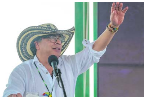
La propuesta de una Constituyente sigue generando diversas reacciones.

gentes políticos en debate, no, la constituyente no es entre los dirigentes tradicionales del país, es darle el poder a la población. Entonces el dirigente de arriba Vargas Lleras se equivoca, ahí es la población el común y la ciudadanía adquiriendo poder de decisión".