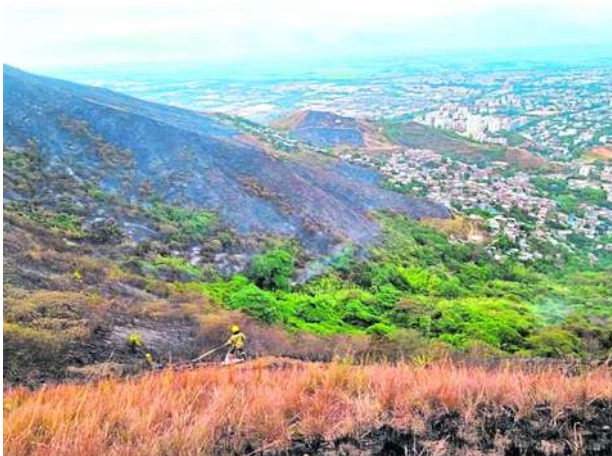
El Niño aún no termina, por lo que hay que mantener las medidas para evitar emergencias.

Las recientes lluvias han generado un respiro pero los expertos indican que los suelos todavía se encuentran muy secos y existe la posibilidad de la activación de incendios forestales como los registrados en los últimos