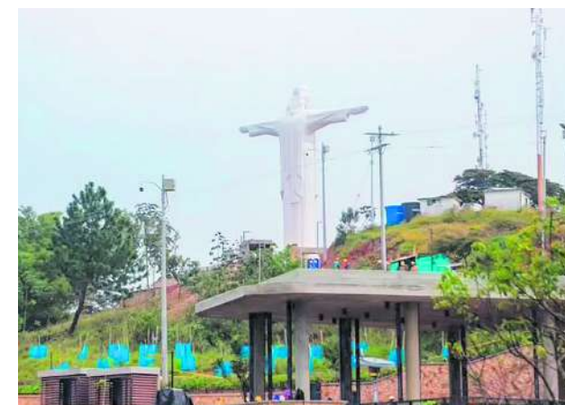
Según la Personería, hay algunos retrasos en la obra de Cristo Rey que no permiten su apertura en la temporada de Semana Santa.

En el recorrido se determinó que el tramo 5 del proyec-