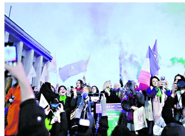
La inclusión en la Constitución hará mucho más difícil impedir que las mujeres accedan a servicios de aborto de manera segura y legal

Diecisiete ciudadanos colombianos se encuentran actualmente detenidos en Haití en relación con el asesinato del presidente Jovenel Moise en 2021.