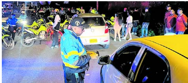
Durante este operativo, se realizaron un total de 78 procedimientos que resultaron en la inmovilización de 44 vehículos.

La iniciativa también incluyó la implementación de un plan candado en la vía al mar, especialmente en el