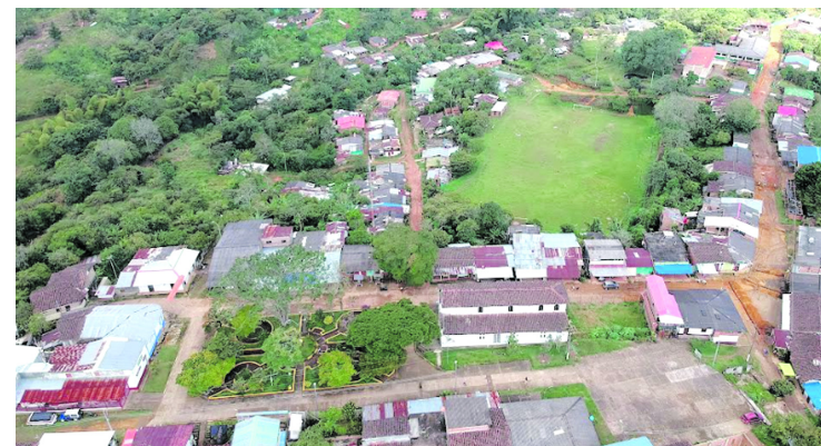
La situación de seguridad es compleja en la zona rural de Jamundí debido a la presencia de las disidencias de las Farc en varios corregimientos y veredas.

La gobernadora también reiteró que este municipio del sur del Valle es una de sus prioridades. “Desde que llegamos estamos empeñados en recuperar el control territorial de la zona rural de Jamundí, no puede haber terrenos vedados para la comunidad ni para la institucionalidad y en eso hemos venido trabajan-