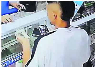
En el video, se muestra cómo este individuo, vistiendo una camisa blanca con una raya negra, ingresa al establecimiento simulando ser un cliente

El robo a la droguería en el sector de La Luna generó preocupación en la comunidad local, ya que evidencia la vulnerabilidad de los comercios ante la delincuencia. Las imágenes captadas por las cámaras de seguridad permiten recon-