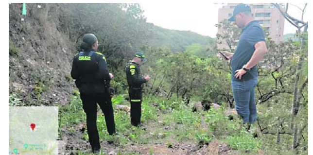
Autoridades verifican presunta invasión de montaña en Altos de Normandía tras denuncias de la comunidad.

Los operativos sorpresa y el plan candado en la vía al mar son parte de una estrategia integral de seguridad implementada por la Alcaldía de Cali.