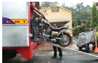
Operativos de tránsito en Cali generan debate por el uso de furgones en lugar de grúas para transportar vehículos.

de furgones en lugar de grúas para transportar vehículos en operativos de tránsito generaron un intenso debate en Cali. Algunos residentes cuestionan si estos métodos cumplen con la normativa vigente, mientras que otros expresan preocupación por la seguridad de los vehículos durante el transporte.