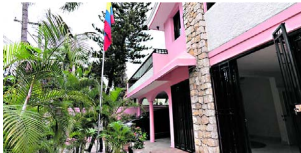
El Ministerio de Relaciones Exteriores expresó en un comunicado emitido hoy su preocupación por los hechos de violencia en la cárcel civil de Puerto Príncipe. Antetítulo: Conozca aquí por qué

Las autoridades colombianas confirmaron que 17 ciudadanos se encontraban entre los detenidos en Haití y tomaron acciones inmediatas para proteger su integridad física. En respuesta a la solicitud de la Cancillería, el Gobierno de Haití trasladó a los detenidos a otras instala-