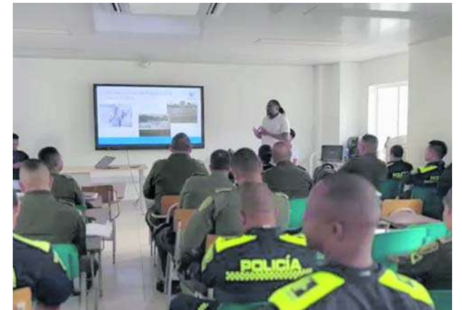
En la Escuela de Policía Simón Bolívar de Tuluá se capacitan policías en enfoque étnico y mil jóvenes como monitores de convivencia y seguridad humana.

Además del edificio Gobernación, estos pagos pueden realizarse en los bancos de Occidente, Bogotá, Davivienda y AV Villas.