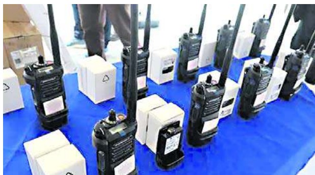
Las autoridades entregaron dos vehículos, 11 motocicletas, 131 chalecos, 64 radios, 359 baterías, 21 computadores con licencias y 61 detectores de metales.