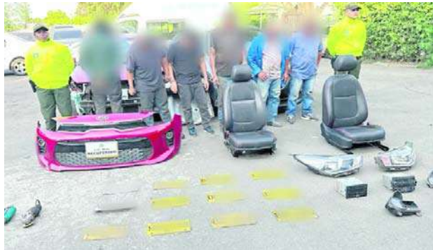
Se incautaron más de 30 autopartes, algunas de las cuales tenían reporte de hurto en el año 2023.

Durante un acto celebrado en la Terminal de Aguablanca, las autoridades entregaron dos vehículos, 11 motocicletas, 131 chalecos, 64 radios, 359 baterías, 21 computadores con licencias y 61 detectores de metales a la Policía Metropolitana. Estos recursos serán utilizados para reforzar las labores de vigilancia y control en el sistema de transporte masivo de Cali.