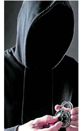
En ambos casos, cuatro personas actuaron juntas, con dos de ellos distrayendo a los vendedores mientras los otros perpetraban el robo.

Estos incidentes muestran una tendencia preocupante en la ciudad, donde presuntos delincuentes operan con tácticas específicas para cometer robos en establecimientos comerciales. La Policía de Cali intensifica sus esfuerzos para identificar y capturar a los responsables de estos delitos, y se insta a la comu-