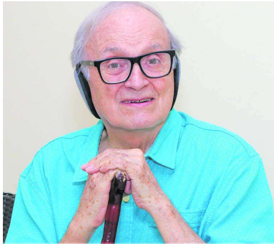
Siempre controversial, Gustavo Álvarez Gardeazábal sostiene que el narcotráfico fue una revolución en Colombia, pero incompleta.

Esta novela retrata una historia que se desarrolla en los años 80 y 90, el "Comandante Paraíso" busca dominar no solo el tráfico de drogas, sino también la economía, el orden público y la vida social y cultural del país, algo que, sin duda, los narcotraficantes lograron,