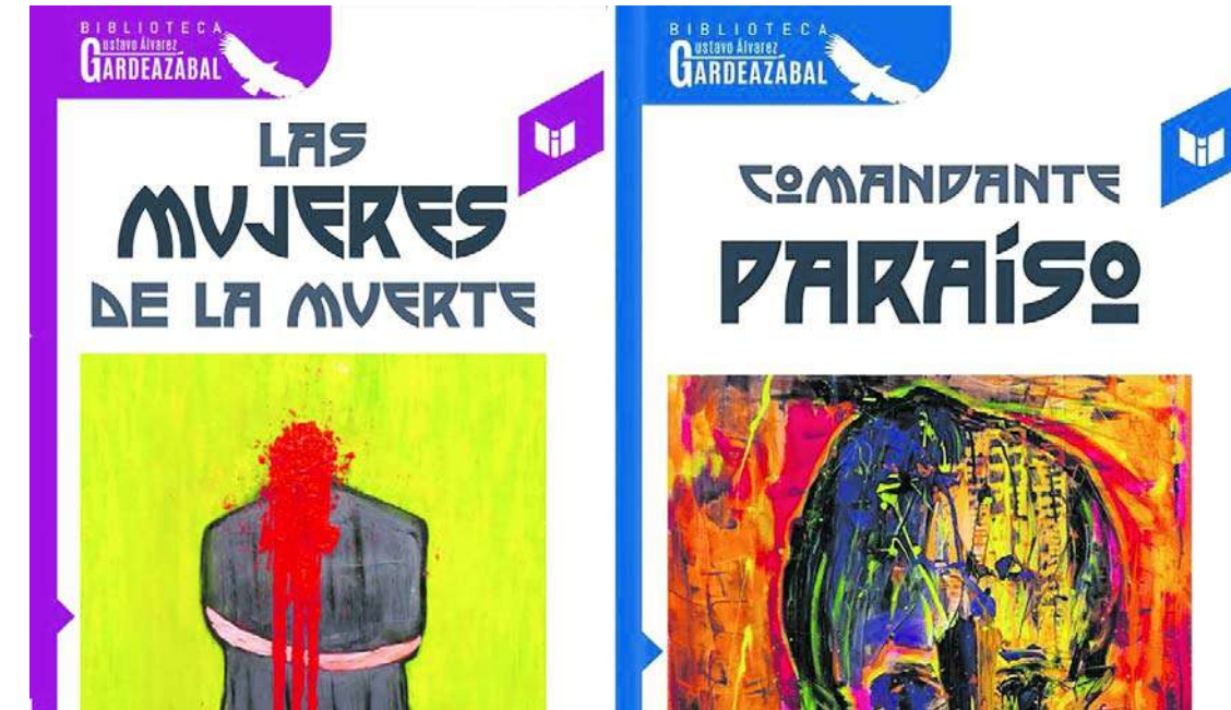
Después de Comandante Paraíso, la siguiente entrega de la Biblioteca Gardeazábal será Las mujeres de la muerte, que aborda la violencia en Colombia desde las víctimas femininas.

Por supuesto. Gobernar a Tuluá en 1988 y 1992 era gobernar una ciudad en donde no menos de uno o dos centenares de reconocidos ciudadanos aspiraban a graduarse de trepadores sociales actuando