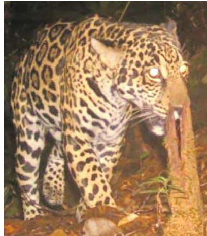
Un jaguar fue captado a través de una cámara trampa instalada por CVC en Bahía Málaga.

están muy saludables. Qué bueno, esto demuestra que todo lo que estamos haciendo para recuperar nuestros ecosistemas está funcionando”.