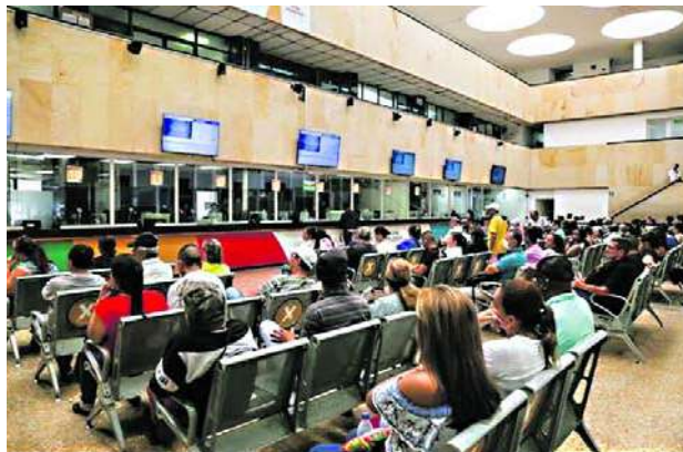
Los vallecaucanos han atendido el llamado de la Gobernación para el pago de los alivios tributarios.

Ramírez recordó que la fecha inicial de pago venció el 29 de febrero de este año.