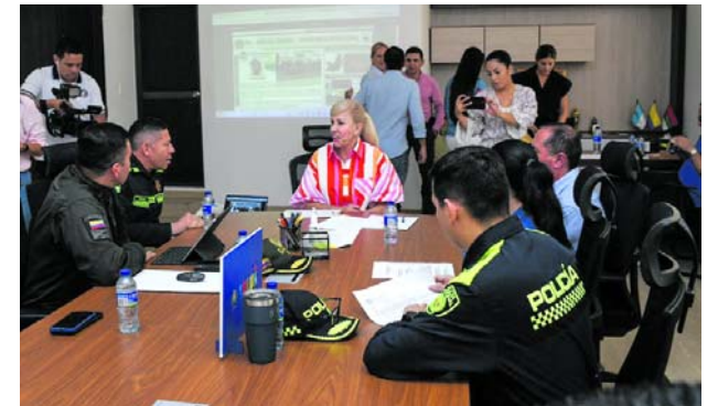
Durante un consejo de seguridad en la Alcaldía de Tuluá, se analizó el modus operandi de 21 capturados de la banda criminal "La Inmaculada".

En el sur del Cauca, en el municipio de Argelia en el sur del Cauca, por lo menos 400 personas han resultado desplazadas, producto de los enfrentamientos entre las mismas disidencias de la estructuras "Carlos Patiño" y de la "Segunda Marquetalia" por el control territorial.