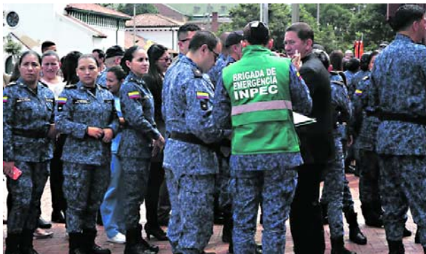
El Inpec investiga la muerte de dos de sus miembros. Otro integrante de la entidad fue herido.

martes se registraron los atentados en los municipios de Buga y Tuluá, mientras que, en la noche del 8 de abril se presentó otro atentado en Palmira, donde fue baleado un exfuncionario del Inpec, que hace pocos meses había salido pensionado de esa entidad.