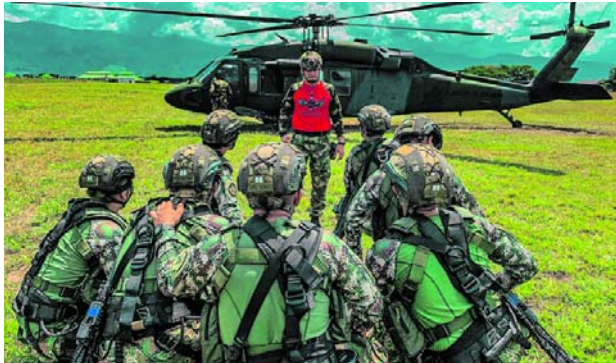
El Ejército mantiene los operativos en el norte del Cauca contra los grupos ilegales.

En Toribío, por lo menos veinte familias estuvieron confinadas dentro de un salón comunal en el resguardo indígena de Tacueyó al quedar en medio de los combates entre tropas del Ejército e inte-