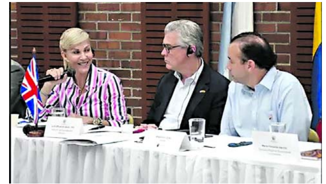
Una delegación británica conoció los proyectos que vienen impulsando la Alcaldía de Cali y la Gobernación del Valle.

Su posesión genera nuevas expectativas en la ciudad, sobre todo en la continuidad de programas como los comedores comunitarios.