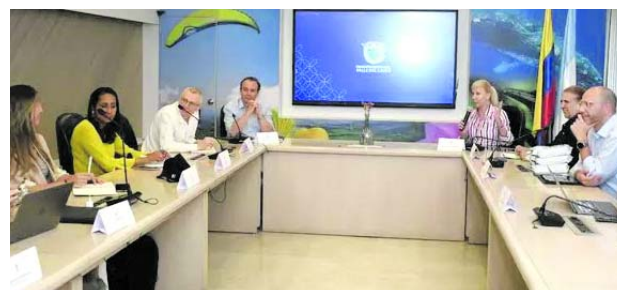
Naciones Unidas destacó los avances en los preparativos de la COP16.

El delegado dijo que "estamos muy contentos que Cali sea anfitrión de la COP 16, es la primera reunión de todos los países y todos los actores sobre biodiversidad, después del acuerdo histórico de 2022 en Montreal. Esta COP da impul-