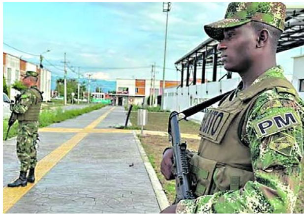
El gobierno departamental y la fuerza pública mantienen un control en la cordillera Central.

La gobernadora indicó que “tengo que decirles que allá