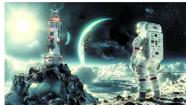
“Ella es astronauta virtual 2024” tiene cien cupos para niñas en toda Colombia.

Por ahora no se ha conocido alguna hipótesis sobre este percance.