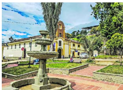
En Jambaló también se presentaron enfrentamientos entre la policía y los grupos ilegales.

Uno de los hechos terroristas se presentó en el municipio de Jambaló donde una estructura ilegal hostigó a la Fuerza Pública lo que generó intensos enfrentamientos que se extendieron por