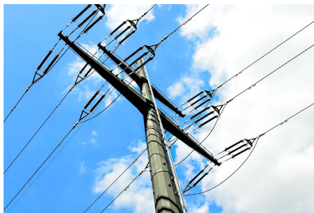
El gobierno anunció que por ahora no hay racionamiento de energía, pero los gremios piensan lo contrario.