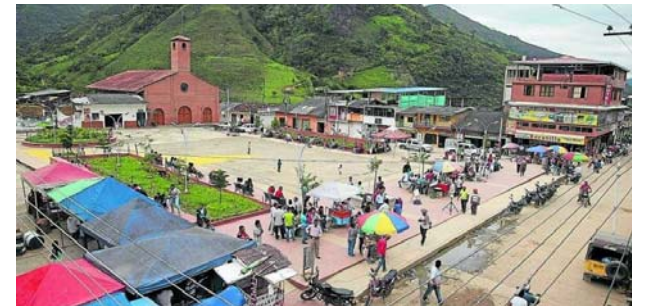
El Ejército denunció un ataque a sus uniformados en la zona rural de Argelia.

La alerta se generó por el recrudecimiento del conflicto armado y la violencia.