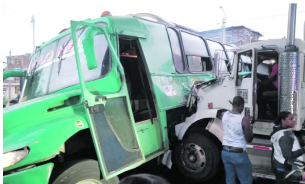
El accidente de tránsito se presentó en la vía que de Candelaria conduce a Puerto Tejada.