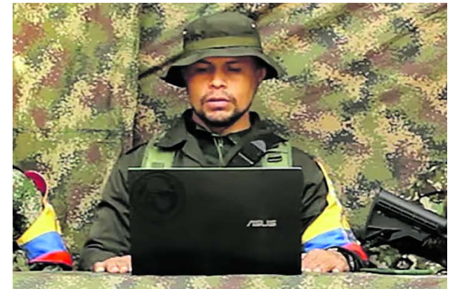
Las disidencias de las Farc anunciaron la creación de un nuevo bloque para apoyar a Estado Mayor Central.

Así mismo, los homicidios bajaron un 38% en esta Semana Santa.