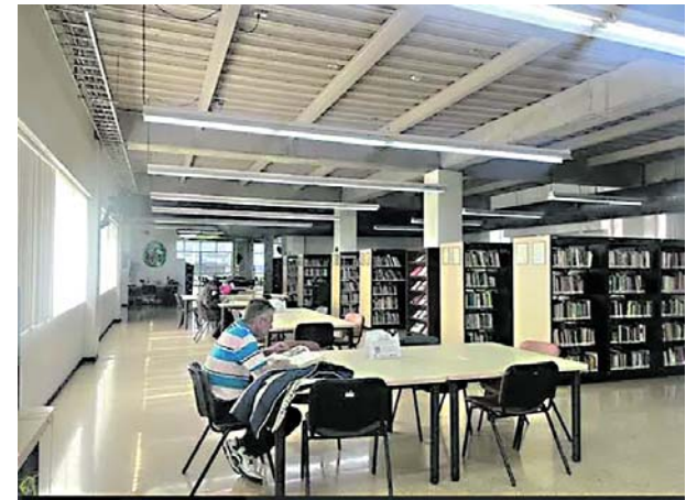
Con el fin de mejorar su servicio, la Biblioteca Departamental amplió sus horarios.

Por otra parte, con la revisión hecha a los estudios de prefactibilidad y factibilidad, se concluye que la construcción de la Central Intermodal de Transporte - CIT Sur - en el lote contiguo a la ciudadela deportiva, no es funcionalmente viable porque carece de las condiciones necesarias para su funcionamiento técnico y financiero dijo el alcalde Ramos.