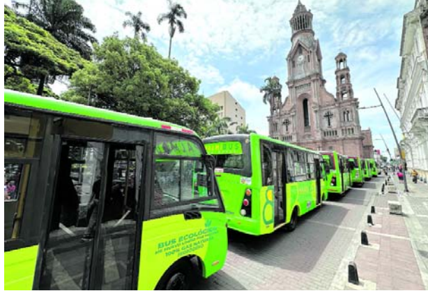
Fueron presentados los primeros buses de transporte público Palmibus en Palmira.

Montebello, Transgaviota y Palmirana y tendrá un costo de $2.600 pesos, que por ser integrado con el Servicio Público de Bicicletas, cuenta con un subsidio para los portadores de la tarjeta de Palmibici de $600 pesos, por lo que cancelarán sólo $2.000 pesos.