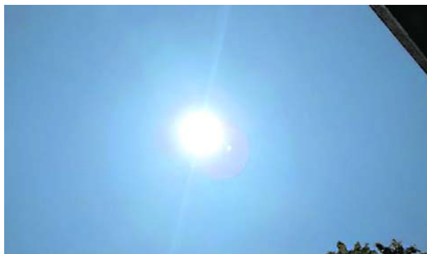
La CVC mantiene un permanente monitoreo a las temperaturas y las precipitaciones en la región.

Por otra parte, el Gobierno Nacional dijo que verificará qué tan real es su creación.