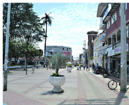
La fuerza pública mantiene operativos en zona rural de Jamundí.

Según informó el mayor general Rodríguez, en la zona rural de Jamundí se viene adelantando una operación militar