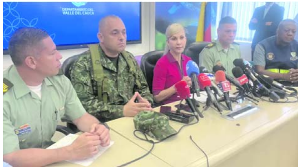
La gobernadora del Valle, Dilian Francisca Toro, y las autoridades del Ejército y la Policía presentaron un balance sobre la seguridad en el departamento durante Semana Santa.

Pese a las altas temperaturas y las pocas lluvias reg-