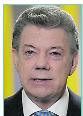
Juan Manuel Santos

¿Cali seguirá siendo un bastión de la izquierda, en las elecciones de 2026?