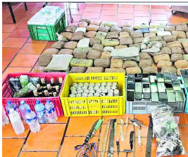
La Policía y el Inpec ubicaron un centro de acopio de estupefacientes en el techo de la cárcel de Jamundí.