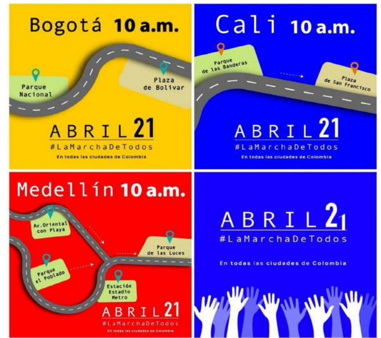
Con esta imagen se promueven las marcha de este domingo en Bogotá, Cali y Medellín.

Además de Gaviria, se espera la participación de otras figuras de diferentes tendencias políticas, como el exsenador Juan Manuel Galán, el excandidato presidencial Sergio Fajardo, el concejal y excandidato a la Alcaldía de Bogotá Juan Daniel Oviedo y el exministro Rudolf Homes. La presencia de estas personalidades amplifica el alcance y la relevancia de las movilizaciones contra el gobierno nacional.