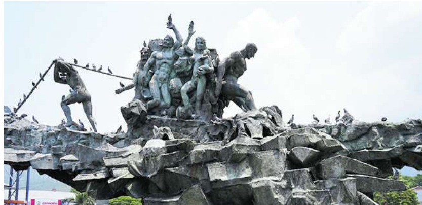
El monumento, inaugurado en 1995 por la Asociación Iberoamericana de Cámaras de Comercio, es un símbolo de solidaridad para los caleños.

El monumento, inaugurado en 1995 por la Asociación Iberoamericana de Cámaras de Comercio, es un símbolo de solidaridad