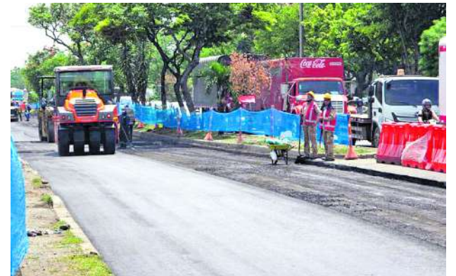
Esta intervención forma parte de la meta de recuperar al menos 300 kilómetros de la malla vial de la ciudad durante el cuatrienio.