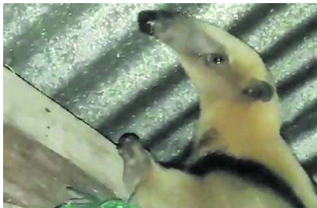
La CRC adelanta una campaña para proteger al oso hormiguero en el Macizo Colombiano.

nidad del municipio y sectores aledaños un mensaje de sensibilización frente a la conservación de esta especie, catalogada como uno de los mamíferos más antiguos de Sudamérica.