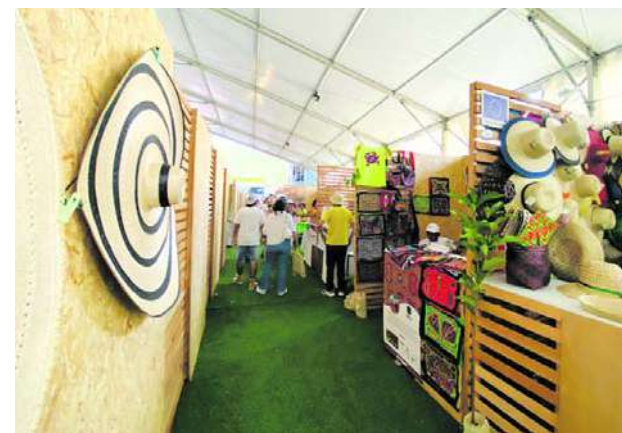
Con el "Primer Encuentro de Negocios Verdes" se busca brindar un impulso a los caleños que le han apostado a la producción limpia.

Mira Pontón añadió que "la COP16 de biodiversidad está facilitando diálogos y alianzas estratégicas para esta transición económica verde en nuestras ciudades".