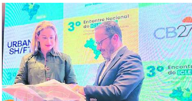
Santiago de Cali y Belem de Pará firmaron un convenio de cooperación técnica de cara a la COP.

Como se recordará Belém de Pará en Brasil y Santiago de Cali, son sedes de las cumbres sobre cambio climático y biodiversidad más importantes del