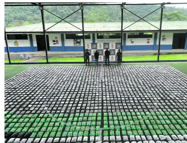
Más de una tonelada de marihuana fue incautada en costas chocoanas.

Así mismo, el 29 de abril se realizará el foro "Descentralización y autonomía territorial" y se hará el lanzamiento del libro "Contraloría Departamental del Valle del Cauca, una Contraloría centenaria".