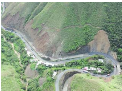
El Inviás anunció obras de mejoramiento al corredor vial Cali- Loboguerrero.