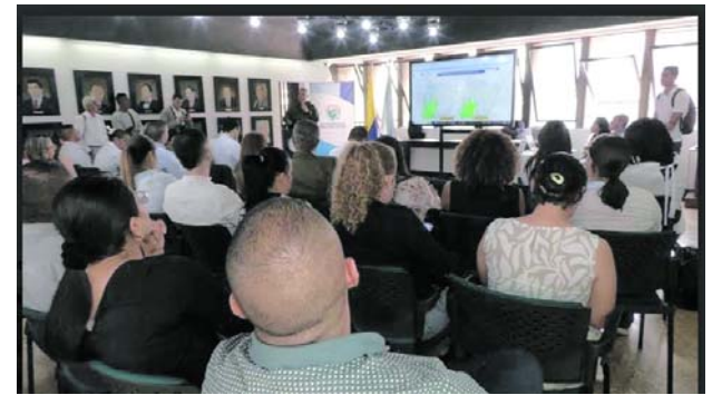
El gobierno del Valle anunció medidas para prevenir el abuso de menores en el turismo.

Los galenos exigieron el respeto a la vida de los integrantes de esta misión médica luego que fueron amenazados por un hombre luego de que su esposa, quien fue atendida para dar a luz, debiera ser remitida a una clínica de Cali luego de complicaciones en el parto.