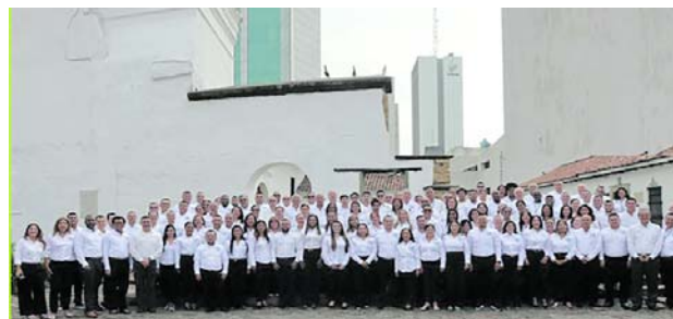
El equipo de la Contraloría del Valle está de plácemes por los cien años de creación de la entidad

ciendo la importancia de su Contraloría centenaria; también extendiendo este agradecimiento a los ex contralores departamentales, algunos de los cuales han ocupado los más altos cargos en el área del control fiscal en el país, por el entusiasmo con el que han acogido esta conmemoración. En nombre de todos y cada uno