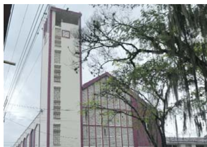
Los hechos se presentaron en la zona urbana del municipio de Ansermanuevo.

liminar, son cuatro hombres y una mujer quienes fueron trasladados a centro asistenciales de Cartago y la ciudad de Pereira.