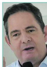
Germán Vargas Lleras

Una muestra de ello, sostuvo el senador, es que en Cali, considerada un fortín del petrismo, fue elegido alcalde Alejandro Eder y no un candidato afín al presidente.-