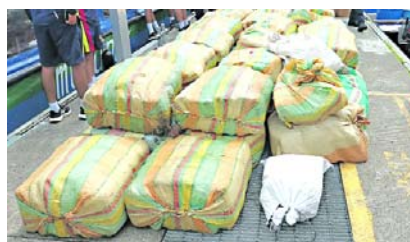
Más de una tonelada de marihuana fue incautada por la Armada en el Pacífico.

Así mismo, en desarrollo de las actividades operativas alineadas a la ofensiva nacional contra el delito y a la estrategia policial “Seguridad en el Territorio”, la capturó un hombre en flagrancia que realizaba disparos al aire en Palmira.