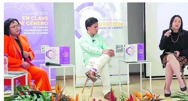
Durante la presentación del informe, la Dian propuso que las mujeres paguen menos impuestos.

Por otra parte, la Fiscalía inició la investigación para determinar quienes fueron los autores de este atentado.