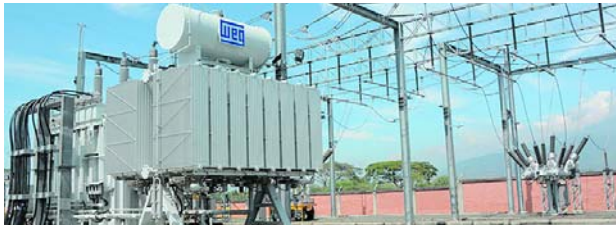
Emcali seguía trabajando ayer para restablecer el servicio de energía a varios caleños.

La lancha fue identificada por unidades de la Armada de Colombia desplegadas en el mar y de inmediato una unidad de Guardacostas realizó la interdicción marítima.