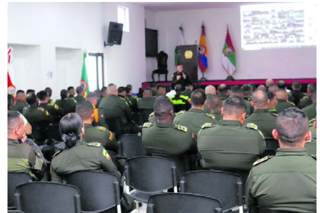
Fue presentada la nueva estrategia de la Policía para atender a la comunidad.