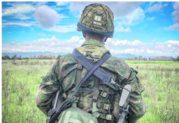
Se mantiene la alerta en el Cauca ante el incremento de los combates en la región.

la suspensión en los tres departamentos Valle del Cauca, Cauca y Nariño, más de 18 combates se han realizado de parte de las Fuerzas Militares, esto va a contribuir en una avanzada en los territorios donde existe el cese al fuego”.