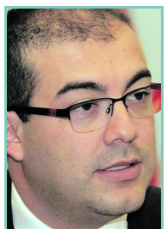
Carlos Abraham Jiménez

El senador Carlos Abraham Jiménez confirmó que su partido, Cambio Radical, tendrá candidato propio a la Presidencia de la República en 2026.