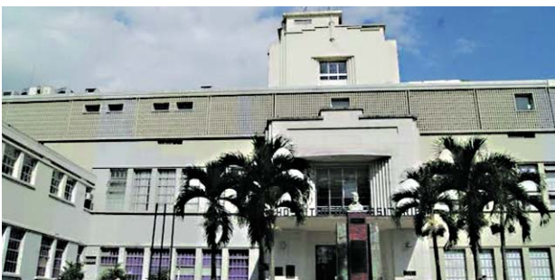
Sigue la polémica por la intervención de dos EPS por parte de la Superintendencia de Salud.

La gobernadora dijo que “me sorprendió la intervención de Sanitas porque ha sido una de las EPS que mejor ser-