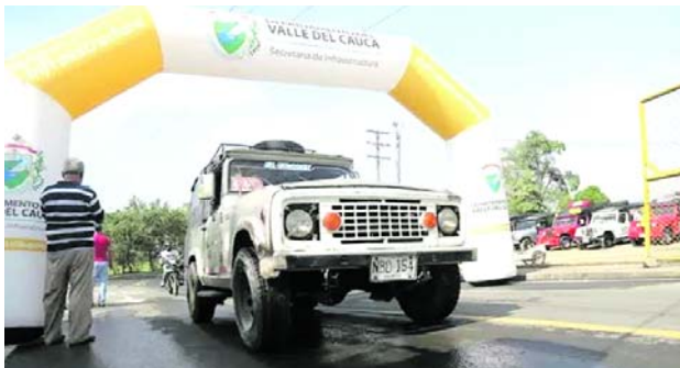
El gobierno departamental sigue fortaleciendo la movilidad en el sector de Juanchito.

cuentan con una muy buena vía de entrada y salida y así le vamos cumpliendo a la comunidad”.