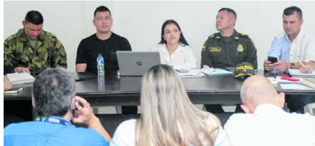
Durante un consejo de seguridad se anunció recompensa por la masacre de Toro.

la Dijin con un grupo especializado para asumir la investigación de este terrible hecho”.