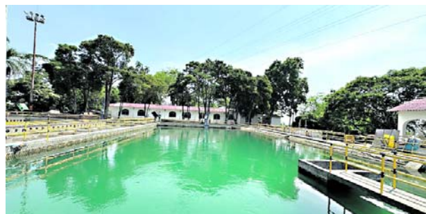
La situación de abastecimiento de agua en Cali no es crítico pero piden ahorrar agua.

Toro enfatizó que “no vamos a ceder, vamos a seguir trabajando para el control territorial de Jamundí”.