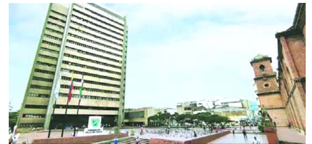
El gobierno departamental garantizó la seguridad en la región.

Las autoridades informaron que con esta serían cuatro las masacres en el Valle del Cauca en este 2024, que dejan catorce víctimas fatales y veinte heridas.