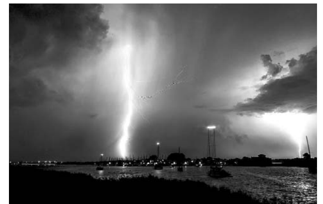
No salga de su casa en caso de una tormenta eléctrica.

Monitoree los estados del clima reportados por el Ideam y la CVC, si tiene un río cercano también debe estar alerta, reporte cualquier novedad a la Cruz Roja, número 132; Bomberos, número 119; Defensa Civil, teléfono 144; Emcali, número 117, Policía número 123. Recuerde no salir de su casa en caso de una tormenta eléctrica, no realice actividades al aire libre.