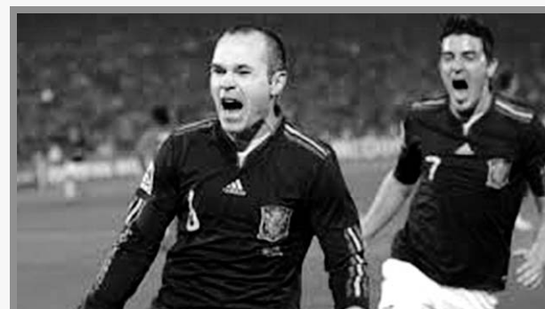
Se reencontrarán en Japón

Villa, quien desde el 2015 milita en el New York City de Estados Unidos, anunció hace algunos días que se irá del club.