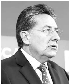
Néstor Humberto Martínez.

Duque manifestó que “vamos a hacer algo muy