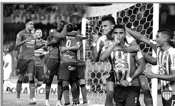
Nueva fecha para la Final de Colombia

Por solicitud de los presidentes que representan a los clubes afiliados a la División Mayor del Fútbol Colombiano - DIMAYOR, durante el desarrollo de la Asamblea Extraordinaria, la administración decidió modificar las fechas para disputar la Final en la Liga Águila II-2018, que se celebrará entre Atlético Junior e Independiente Medellín.