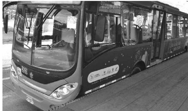
El Alcalde de Cali, acató la sanción pero no la compartió.

En un principio el concesionario Git Masivo pretendía demandar a Metrocali y obtener 300 mil millones de pesos por prejuicios e intereses, pero el tribunal accedió a concederle solamente el 36% de esta suma. Además, esta compañía tenía una intención secundaria por 700 mil millones de pesos, alegando una li-