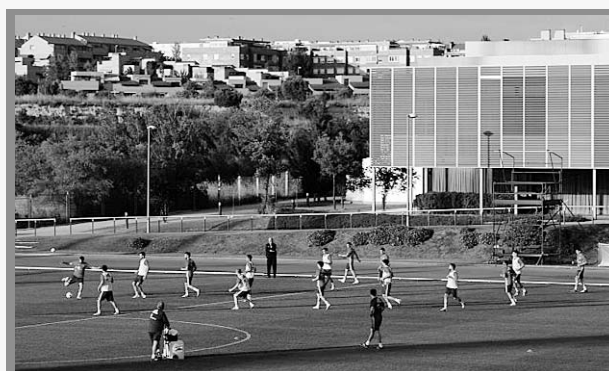
Definidas las sedes de River y Boca

La definición de la Copa Libertadores 2018 entre River y Boca en Madrid, España, va tomando color luego que trascendiera los predios donde cada equipo se entrenará de cara al duelo del 9 de diciembre en el Santiago Bernabéu. El plantel del Millonario utilizará la Ciudad Deportiva del Real Madrid en Valdebebas, que fue inaugurado en 2005 y cuenta con más de una decena de canchas en su interior. Mientras que la delegación xeneize lo hará en la Ciudad del Fútbol de Las Rozas, donde la Real Federación Española de Fútbol lleva las prácticas previas a las competencias internacionales. Fue inaugurado en 2003 y tiene cuatro canchas.