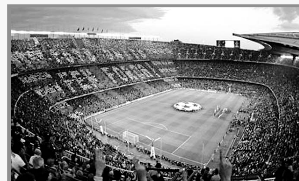
Barcelona inconforme con el Madrid

Generó polémica en Barcelona la decisión de que el Santiago Bernabéu sea la sede para la final de la Copa Libertadores del presente año. Esto tiene que ver