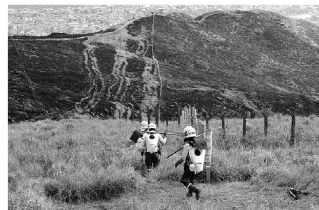
Así quedó el cerro de Cristo Rey después del voraz incendio del fin de semana.

volver a empezar. Tenemos mucho dolor; la ciudadanía está muy dolida pero hay que volver a empezar con la restauración de inmediato, tenemos que esperar unos días y más o menos en una semana vamos a empezar de nuevo", dijo la directora del Dagma.