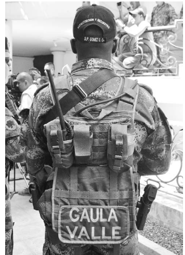
En los operativos interviene el Gaula metropolitano de Cali.

Gracias al plan de choque en pro de la seguridad, llamado 'El que la Hace la Paga', ordenado por el presidente Iván Duque para todo el país, se han desarticulado bandas dedicadas a la extorsión y se está tras la pista de otros delincuentes.