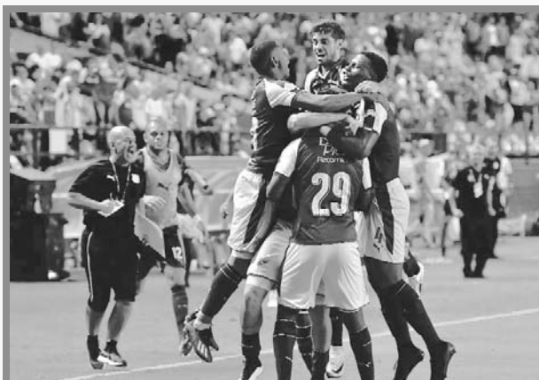
Cali es séptimo y visita el jueves a Equidad

Tres puntos para que el azucarero retorne a los ocho