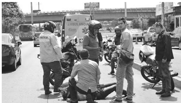
Cali y el Valle del Cauca están entre las regiones con mayores accidentes de tránsito.

El informe plantea que los incidentes viales son un prob-