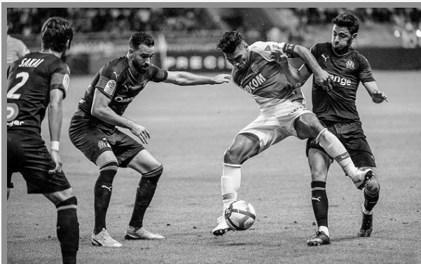
Radamel Falcao anotó su segundo gol del semestre

El atacante colombiano, Radamel Falcao García, anotó en la derrota de su equipo en condición de local 3-2 ante Olympique Marsella. Este es el segundo tanto de la temporada para 'El