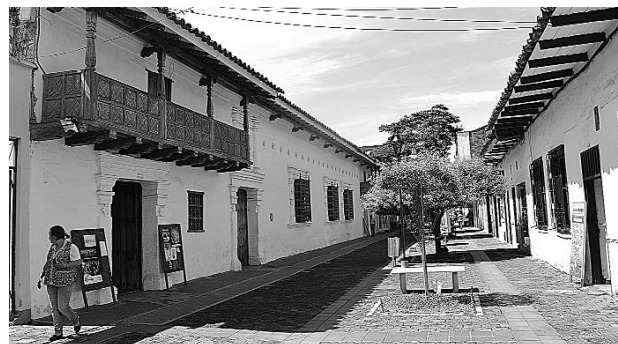
A Cartago llegaron fuerzas urbanas especiales para mejorar la seguridad.

arremeter contra las estructuras delincuenciales organizadas, sobre las que inicialmente se dirigen las investigaciones por este hecho.