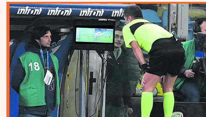
El VAR comenzará a aplicarse a partir de los octavos de final de la Liga.

Aleksander Ceferin, mandamás de la UEFA, confirmó en Dublín que su máximo certamen, la Champions League, ten-