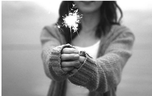
Varios municipios han acatado el llamado del gobierno departamental y han prohibido el uso de la pólvora.

La funcionaria reiteró el llamado a no usar pólvora al