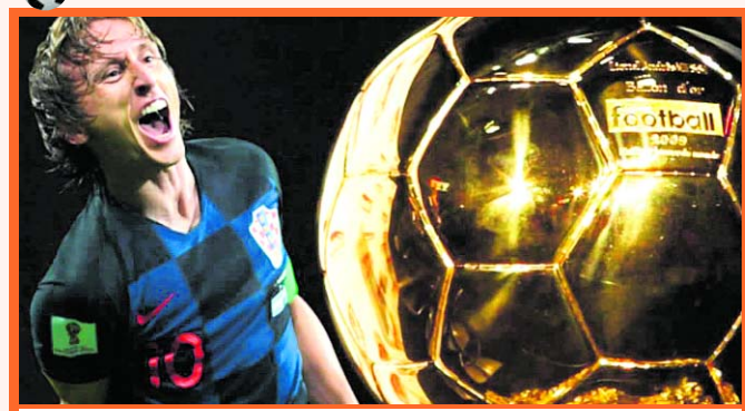
Luka Modric del Real Madrid, obtuvo el Balón de Oro

El Balón de Oro del presente año tuvo un dueño poco habitual a los acostumbrados en los últimos 10 años, Lionel Messi y Cristiano Ronaldo. En esta oportunidad, el croata Luka Modric, abrazó este galardón, poniendo punto final a la hegemonía del argentino y del portugués. El mediocampista del Real Madrid, derrotó en la elección final al ya citado Cristiano Ronaldo, y a los campeones del mundo; Antoine Griezmann y Kylian Mbappé.