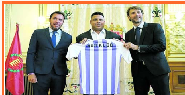
Ronaldo Luís Nazário de Lima, se vinculó a Valladolid

El astro brasileño, Ronaldo Luís Nazário de Lima, se vinculó a Valladolid como el máximo accionista del club del noroeste de España, que milita en La Liga de fútbol de ese país, a la que recientemente ascendió. El anuncio se hizo oficial en el Ayuntamiento de la ciudad, ante la presencia de un centenar de periodistas.