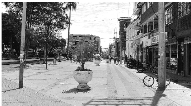
Los operativos se intensificaron en Jamundí para rescatar al líder secuestrado el fin de semana.