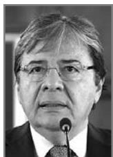
Carlos Holmes Trujillo