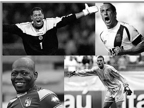
Se viene el partido de las estrellas en el Pascual Guerrero.

Santiago de Cali reafirma su título de capital deportiva de América con la realización de grandes eventos y que más si es el de las pasiones, el de las multitudes, pero con sentido social, el fútbol.