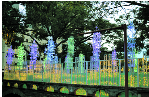
Así se podrá ver el alumbrado navideño en el Bulevar del Río.

"Lastimosamente nos hemos encontrado con situaciones ajenas a la voluntad de la administración (...) En