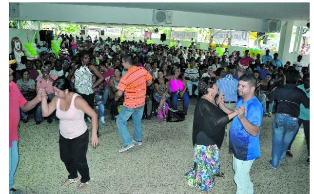
La fiesta será en el salón San Antonio del Acuparque.

Sobre el evento, la directora comercial comentó que habrá sorpresas, rifas y música en vivo para disfrutar: "Estará con nosotros el Ciclón del Valle, un cantante bastante