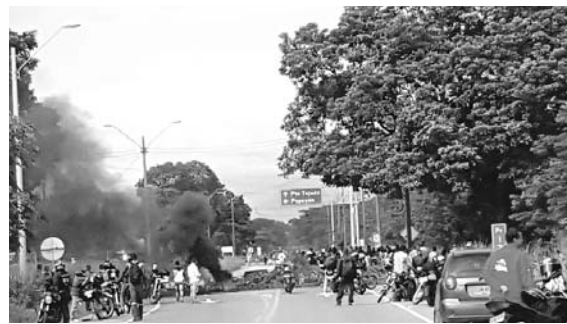
Especial Diario Occidente

Así mismo, según información de las autoridades