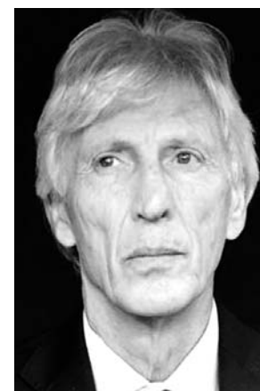
José Pékerman. ¿Qué dice Ventana del ex seleccionador colombiano?...Lea.

- Tomates: por camionados para las empresas que ex-