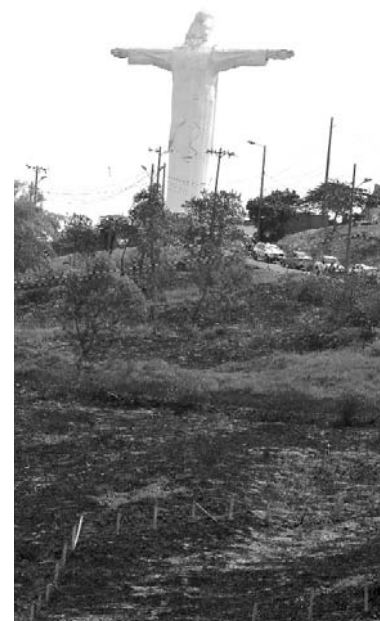
Fueron 114 hectáreas de bosque destruidas.