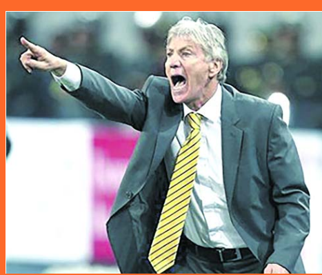
Agradecimiento a Pékerman

Con esta acción, el patrocinador oficial de la Selección Colombia busca unir nuevamente a los colombianos para agradecer y homenajear al argentino que por más de 6 años estuvo al frente del conjunto cafetero y que logró unir a todo un país bajo un mismo color. El legado de Pekerman trascendió los triunfos deportivos y logró posicionar significados y creencias alrededor de símbolos como su corbata amarilla.