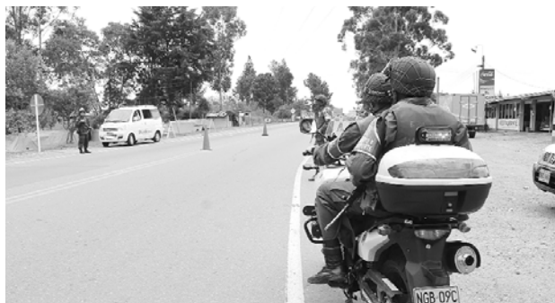
Las autoridades mantienen vigilancia en la vía Cali-Popayán.

timas, por lo menos diez hombres armados, que estaban encapuchados, vestían camuflados y portaban fusiles, detuvieron a por lo menos cinco vehículos que se desplazaban por la vía y se identificaron como miembros del EPL.