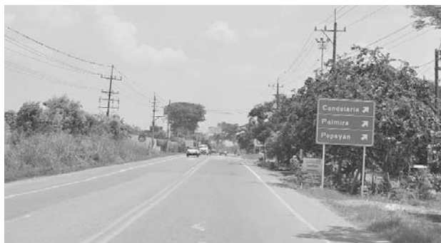
En el sur del Valle y norte del Cauca se busca al líder de Jamundí secuestrado.

Las autoridades recordaron ayer que existe una rec-