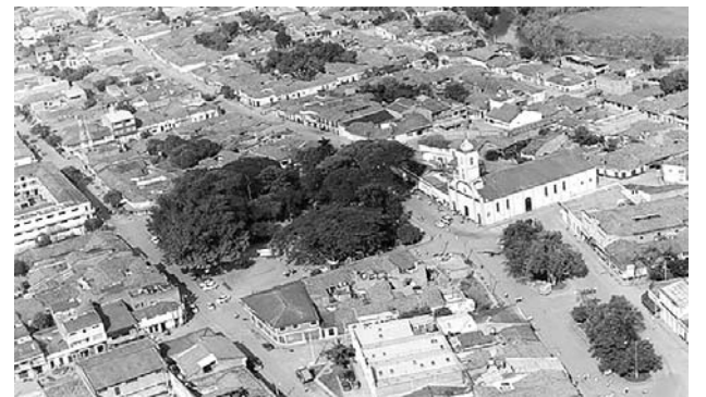
Especial Diario Occidente

Ayer seguían los bloqueos en Puerto Tejada.