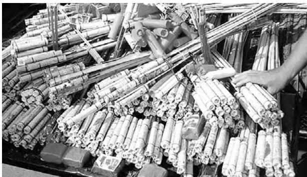
Hay alarma por el incremento de quemados en el Valle.

La gobernadora manifestó que “somos el primer departamento con quemados con pólvora, no puede ser posible, por eso llamo la atención a los señores alcaldes para que por favor saquen el decreto de la prohibición de pólvora, que