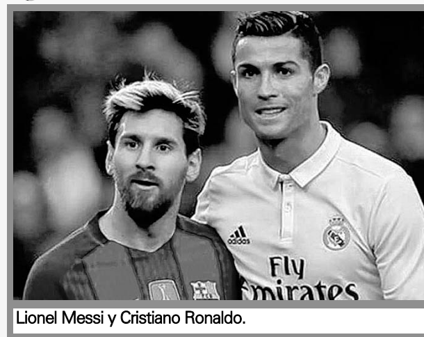
Lionel Messi y Cristiano Ronaldo.

Los dos astros mundiales, Lionel Messi y Cristiano Ronaldo, recibieron una invitación por parte de la Federación Española, para que asistan a la Superfinal de la Copa Libertadores de América entre River y Boca en el Santiago Bernabeu. Ambos dieron respuestas distintas.