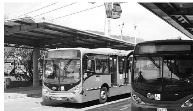
El proyecto entrará en vigencia en el 2019.

a 2 mil pesos. De este pago, se destinarán 840 pesos al plan de salvamento del MÍO.