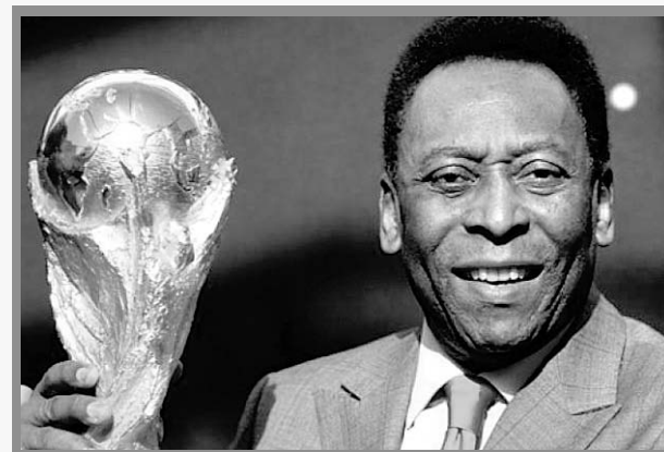
Edson Arantes do Nascimento, Pelé.

"Para mí, Maradona fue uno de los mejores que hubo. Podés preguntarme si fue mejor que Messi. Y lo fue, claro. Mucho mejor. Es cuestión de gusto. Cómo se puede comparar a alguien que cabecea bien, patea con la derecha,