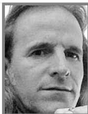
FRANÇOIS R. CAVARD M.

Es mérito del convicto desmovilizado narcoterrorista gustavo francisco petro urrego (minúsculas intencionales por desprecio) reunir en su ser todas las nefandas facetas que ha tenido la criminalidad en Colombia.