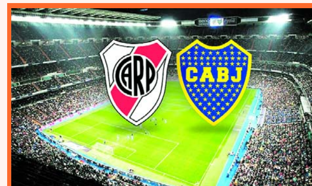
Boca Juniors, recurrirá al TAS,