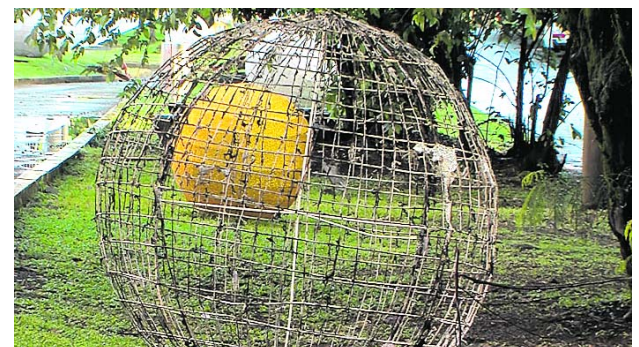
Especial Diario Occidente

En esa zona de la ciudad, sector de la Pasoancho y junto a la ciclovía, los vándalos arrancaron parte del cableado de la iluminación navideña y