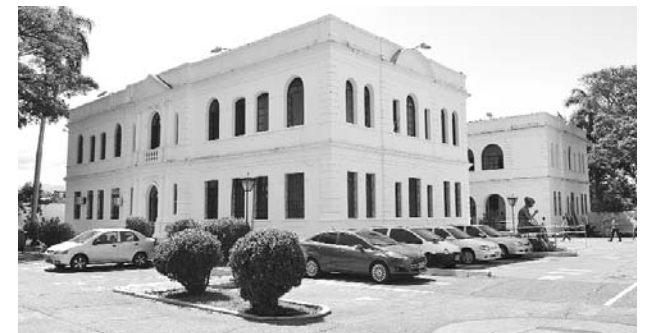
La Alcaldía de Cartago inició un censo a los afectados por la creciente del río La Vieja.

Así mismo, el senador Álvaro Uribe Vélez expresó que "ha muerto un gladiador de la democracia, de la cultura, un humanista, rindamos homenaje a la vida y obra del ex Presidente Belisario Betancur Cuartas".