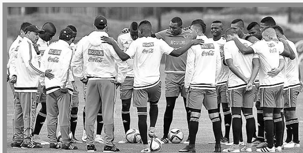
Selección Colombia Masculina Sub-20, se prepara para el Campeonato Sudamericano