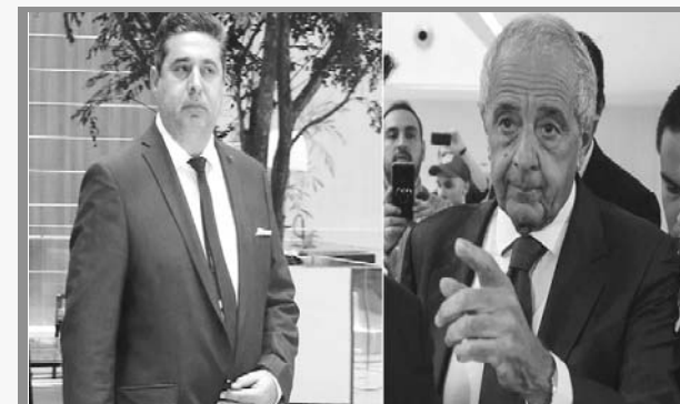
La Final de la Copa Libertadores se disputará en el Santiago Bernabeu de Madrid

Pese a que desde La Ribera se solicitó resolver en un procedimiento abreviado, resulta difícil establecer cuándo se dará a conocer el fallo, que seguramente llevará meses.