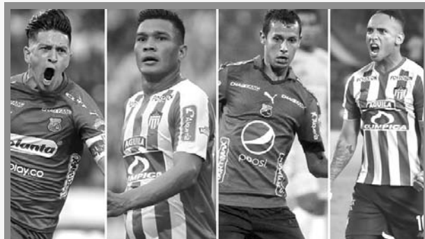
Junior y Medellín vuelven a estar en la final de un torneo.