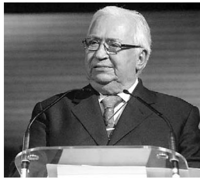
Belisario Betancur, expresidente de Colombia.

El ex presidente Juan Manuel Santos manifestó que "todo honor y toda gloria al Presidente Belisario Betancur. Gran patriota, gran amigo y gran ejemplo de entereza, honestidad y humildad. Nuestras sinceras condolencias a su familia. Colombia agradecida lo recordará por