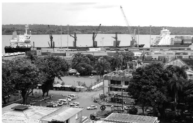
El dragado al canal de acceso es otra de las prioridades.

Una de las prioridades que ha venido apoyando precisamente la Cámara de Comercio de Buenaventura es el gran proyecto de Complejo de Actividades Económicas de Buenaventura, el Caeb, en el cual se busca tener una infraestructura urbana que garantice los servicios básicos, para que las empresas puedan asentarse en el territorio con el liderazgo de la gobernación del Valle, el Departamento Nacional de Planeación y la Presidencia de la República.