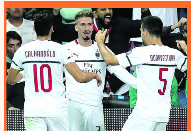
Milan ganó y se recupera en Italia.

Milan ganó su segundo partido del año y se colocó noveno, con 9 puntos y a 12 del líder Juventus; por su parte, el Sassuolo se quedó quinto, con 13 puntos.