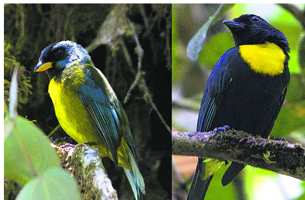
La bangsia cariazul y la bangsia pechidorada le dan el nombre a la reserva natural.

En los próximos meses especialistas en aves, mamíferos y anfibios realizarán varias expediciones a la reserva que permitirán documentar con mayor exactitud su biodiversidad.