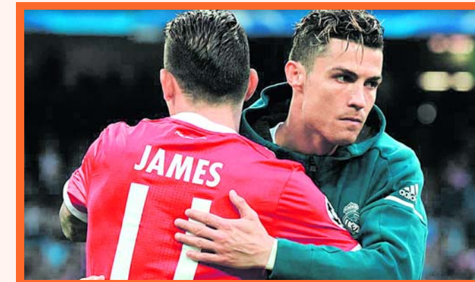
James Rodríguez y Cristiano Ronaldo

El astro portugués, Cristiano Ronaldo, dejó varios títulos en una entrevista que le concedió a La Gazzetta dello Sport. Exceptuando a su amigo Marcelo, lateral del Madrid, CR7 le cerró las puertas a todos sus demás excompañeros del Real Madrid, quienes han sonado para recalar en la Juventus para la siguiente temporada: