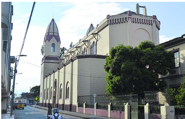
Las autoridades desmantelaron un banda dedicada al tráfico de migrantes en Palmira, Dagua, El Cerrito y Pradera.

Los detenidos, quienes hacían parte de la banda de Piel Rojas, tramitaban documentos como registros civiles, cédulas, pasaportes, para nacionalizar a ciudadanos extranjeros con el fin de sacarlos posteriormente del país, según indicó la Fiscalía Seccional que detuvo a ocho funcionarios de registradurías del Valle, dos funcionarios de Notarías, y seis particulares, entre falsos testigos y