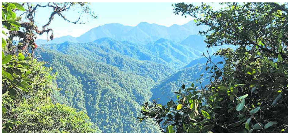
La Reserva Natural de las Aves Las Bangsias está ubicada en la vereda El Placer, de Dagua.