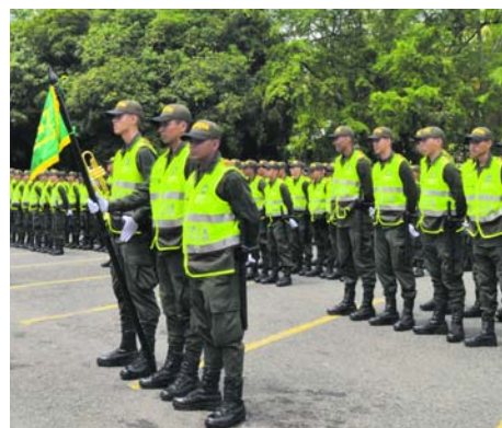
La percepción de seguridad aumentó.

Andrés Villamizar, secretario de Seguridad y Justicia, aseguró que el resultado del 'Cali Cómo Vamos' es bastante positivo: "Según la encuesta, vamos por el camino correcto, no estamos bien pero estamos mejorando.