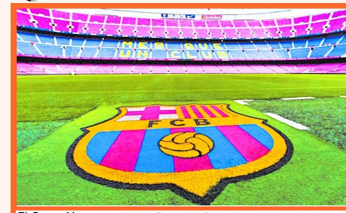
El Camp Nou, estadio oficial del Barcelona.

La junta directiva del Barcelona acordó descartar la posibilidad de viajar a Miami para disputar un partido de la Liga española contra el Girona. El club tomó esta medida tras constatar la falta de consenso existente alrededor de esta propuesta, según precisó en un comunicado.