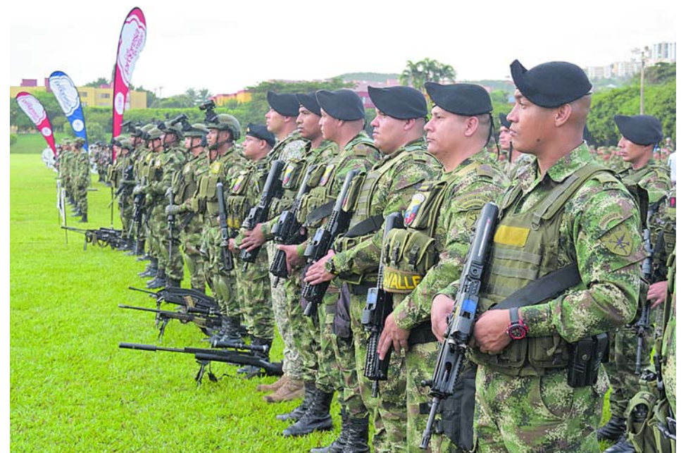
El Ejército apoya la seguridad de la ciudad con 600 unidades que patrullan los barrios más vulnerables de Cali.

Los caleños pudieron arreglar sus problemas dialogando gracias a 47 jornadas de conciliación. Un total de 3.444 infractores del Código Nacional de Policía se capacitaron.