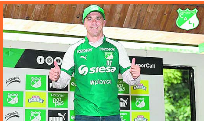
Lucas Pusineri, nuevo entrenador del Deportivo Cali

En una rueda de prensa efectuada en la sede campestre del Deportivo Cali, ubicada en el sector de Pance al sur de la ciudad, la institución azucarera, oficializó la llegada de su nuevo entrenador: El argentino Lucas Pusineri, actual técnico campeón del Torneo de la B con el Cúcuta Deportivo.