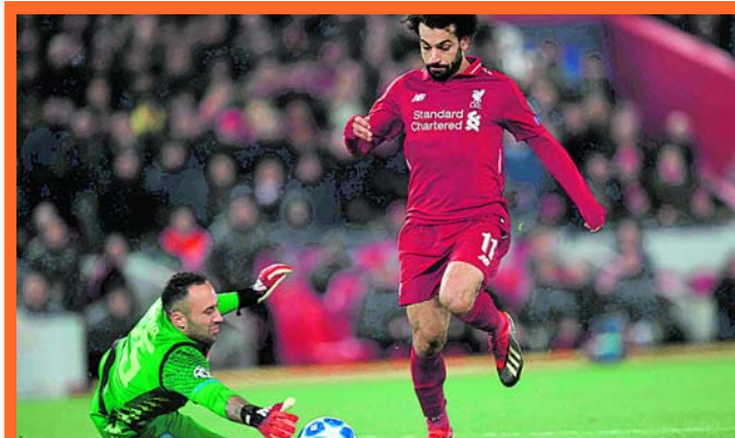
David Ospina con Mohamed Salah.

El equipo inglés, Liverpool, finiquitó las aspiraciones de David Ospina y su Napoli de clasificar a los Octavos de Final de la Champions League, al derrotarlo en Anfield por la mínima diferencia con anotación del egipcio, Mohamed Salah en el minuto 34.