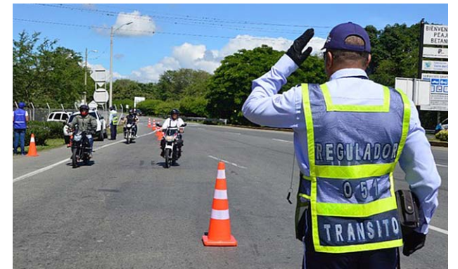
Especial Diario Occidente

Además, la mayoría de los documentos gestionados al parecer irregularmente a los extranjeros, fueron expedidos por la Notaría Cuarta de Palmira, y varios particulares se habrían ofrecido, como testigos, indicó la Fiscalía.