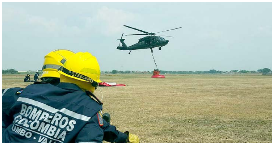
El cuerpo de Bomberos presta desde servicio a incendios hasta ambulancias.

Posterior a esto el alcalde de Cali, Maurice Armitage, aseguró que el cuerpo de Bomberos Voluntarios de Cali tienen presupuesto de sobra: "Los bomberos pasaron de ser pobres a ser los mejores del país. Tienen plata, les sobra la