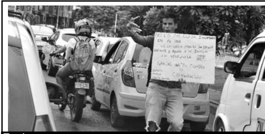
ENVÍENOS SUS FOTODENUNCIAS CON UNA BREVE DESCRIPCIÓN A OPINION@DIARIOOCCIDENTE.COM.CO

¿Qué vamos a hacer? Hay que abrir el debate, porque las cosas no funcionan como están.