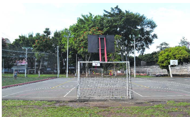
Esta es la cancha de Los Farallones, donde se construirá una cubierta con el apoyo de la Gobernación del Valle.