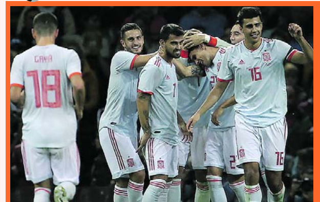
Nueva victoria de la Selección de España

Nuevamente la selección de España dio una señal de su pletórico poderío al golear a la selección de Gales por 4-1 en un amistoso disputado ayer en Cardiff. Triunfo que deja en el pasado, el paso en falso en el Mundial de Rusia, donde fue eliminado en octavos de final por el anfitrión.