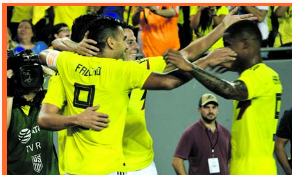
La Selección Colombia venció a su similar de Estados Unidos por marcador de 4-2.

En un partido con una mezcla de todo, la Selección Colombia venció a su similar de Estados Unidos por marcador de 4-2 con goles de James, Bacca, Falcao y Borja. En el primero de un doblete amistoso que Colombia disputará en territorio norteamericano.