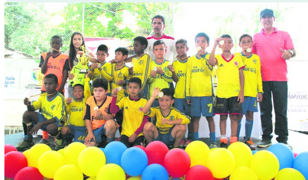
Los Juegos Recreativos y Deportivos integraron a la niñez de la comuna 18.