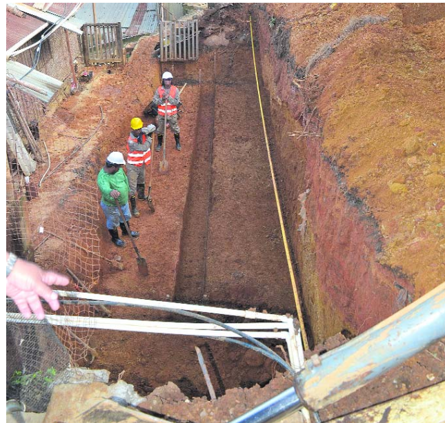
En la parte alta de la comuna 18, sector de Portales de Mirador, se construyen tres muros de contención.

El administrador indica que las canchas estarán para el disfrute de por lo menos 1.500 niños de todos los estratos de la comuna 18 que