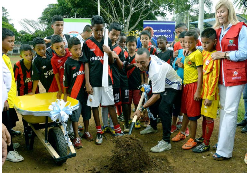
La gobernadora del Valle, Dilian Francisca Toro, estuvo presente en el inicio de la obra de la cancha en Meléndez, Comuna 18

Con la construcción de los muros de contención que la comunidad del barrio Pampas de Mirador pedía desde hace varios años, se hace realidad uno de los anhelos de los residentes de la parte alta de la comuna 18 de la ciudad de Cali.