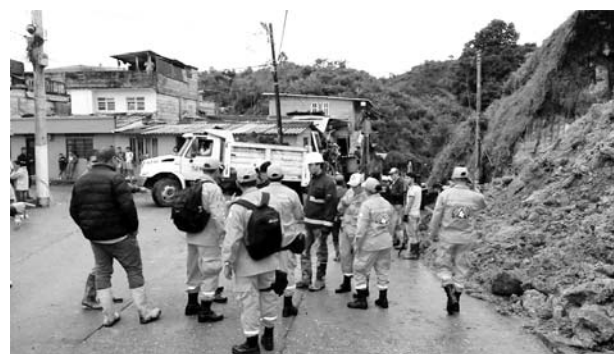
Especial Diario Occidente

En la vía Bogotá- Villavencio continúa este jueves los pasos alternos y cierres temporales en el kilómetro 64 para